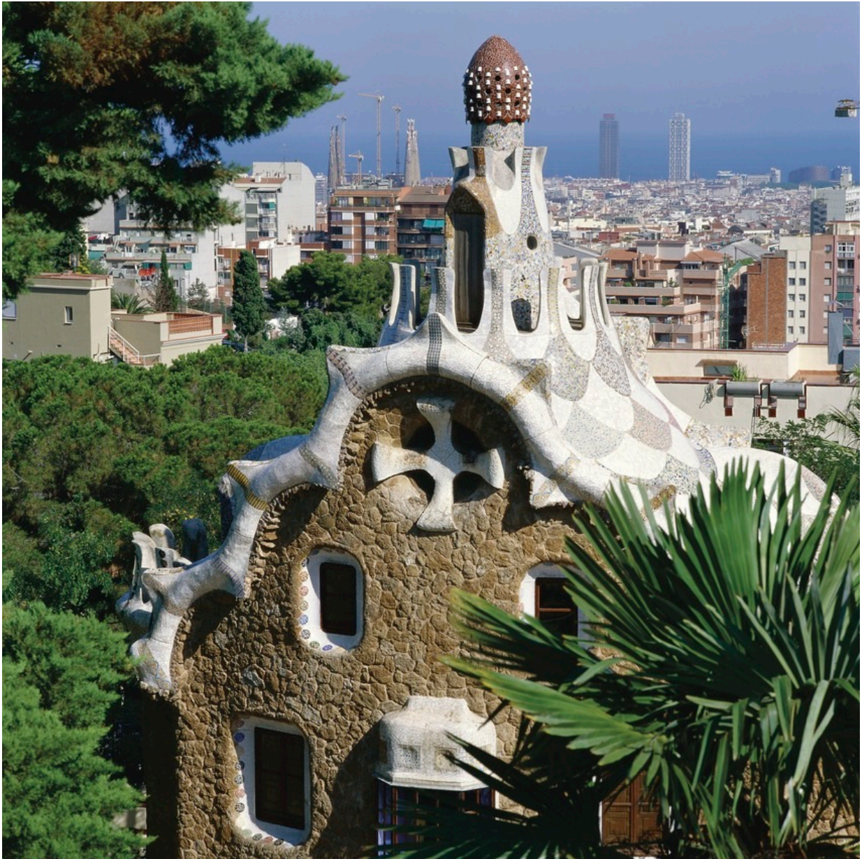
Park Güell