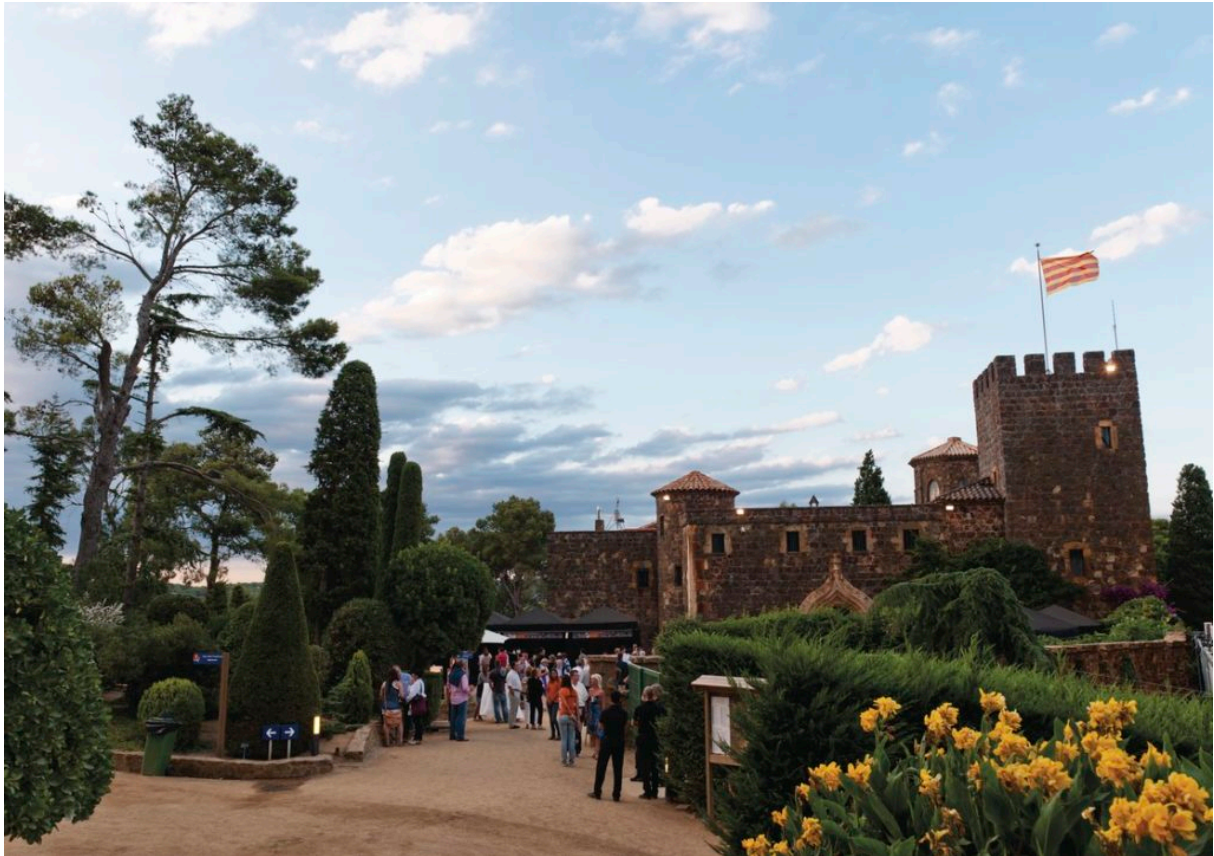
Cap Roig

Weitere Informationen unter: de.costabrava.org