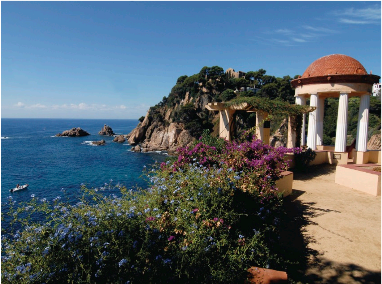
Der botanische Garten Marimurtra

Weitere Informationen unter: de.costabrava.org