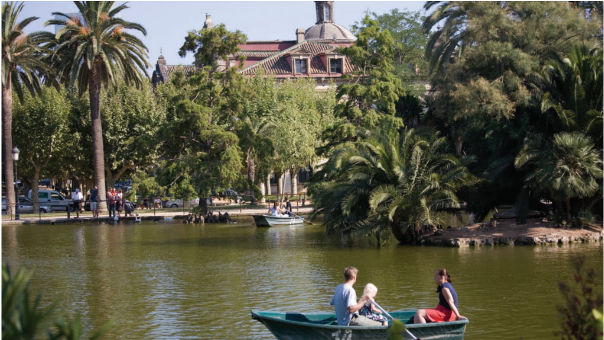
Parc de la Ciutadella