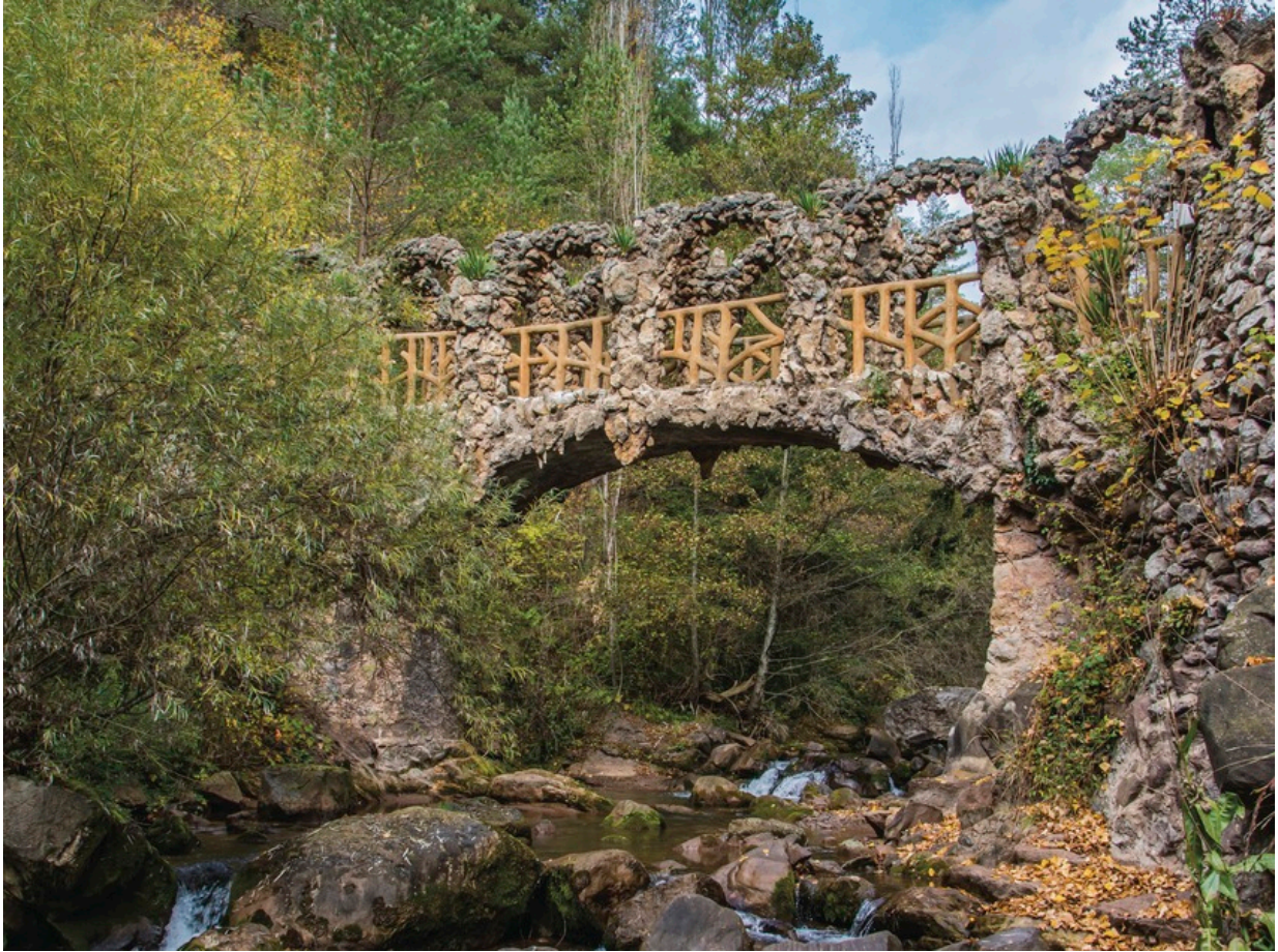
Die Jardins Artigas