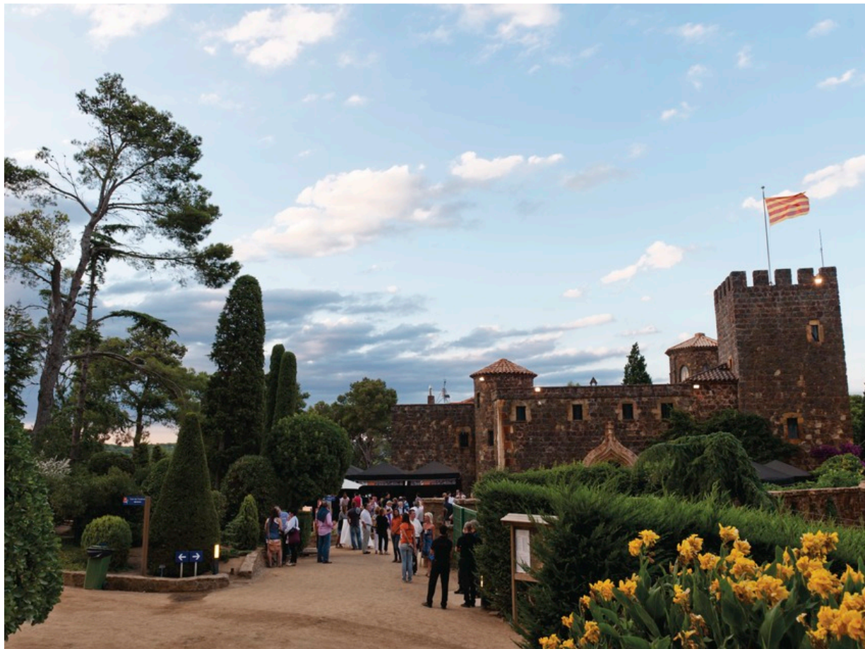
Cap Roig

Palafugell und die Möglichkeit, auf lauschigen Wegen durch die Botanischen Gärten zu streifen. Vor allem jedoch finden sich auf dem Festival Cap Roig Jahr für Jahr die großen Namen der Musikszene ein. Zu diesen zählten im Jahr 2015 unter anderem Sting, Ben Harper & The Innocent Criminals, Tony Bennett und Lady Gaga sowie Macaco, Pablo Alborán und Alejandro Sanz. Das Programm für 2016 steht noch aus, Infos gibt es hier .