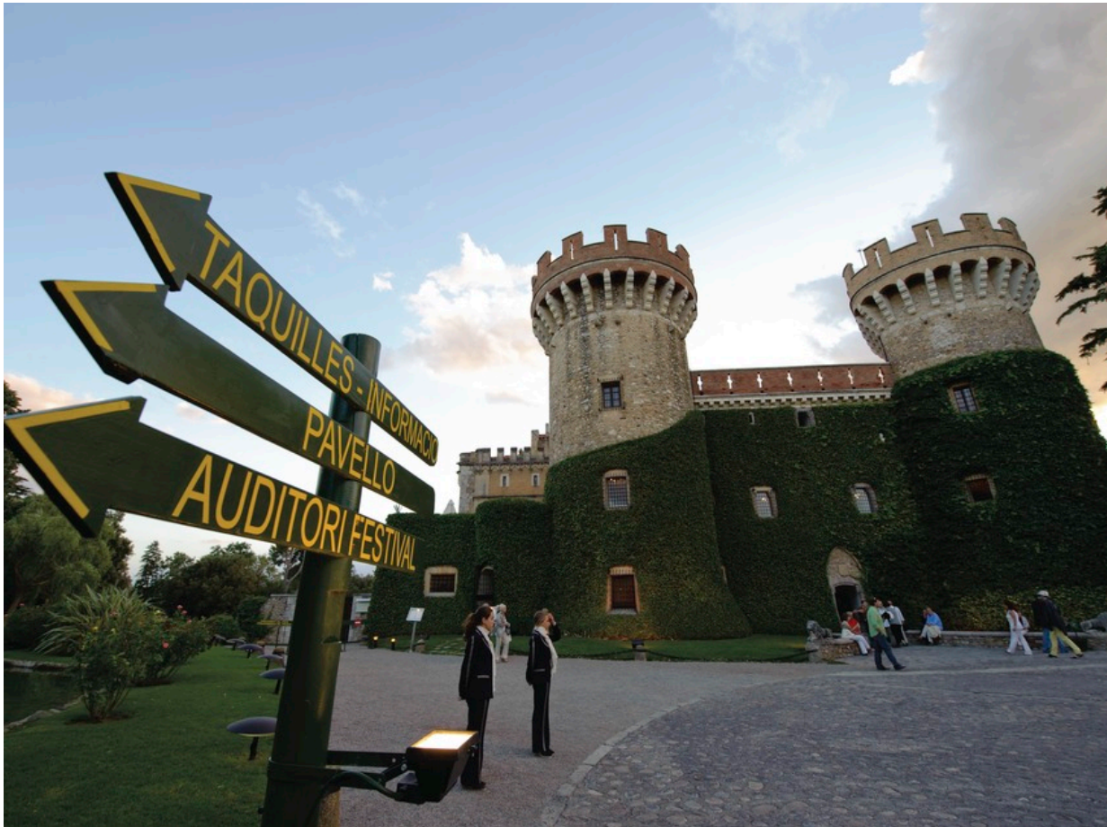
Castell de Peralada

Konzerte fest, die in den Händen der mit einem Michelin-Stern ausgezeichneten Brüder Torres liegt. Guten Appetit! Weitere Infos gibt es hier .