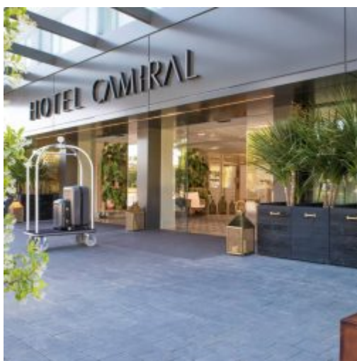
Eingangsbereich des Hotels Camiral

Das mit fünf Sternen ausgestattete Hotel Camiral wurde grundlegend renoviert und 2016 neu eröffnet. Für jeden Geschmack hat das Etablissement das passende Angebot bereit. Sei es mit der Familie oder mit Ihren Sport-Kollegen, im Hotel Camiral findet man Freizeitvergnügen, ein Sporterlebnis auf höchstem Niveau und genussvolle Entspannung.