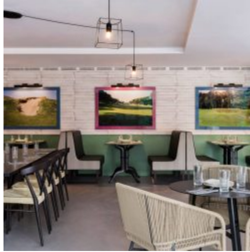
Essbereich am Lavidia Hotel