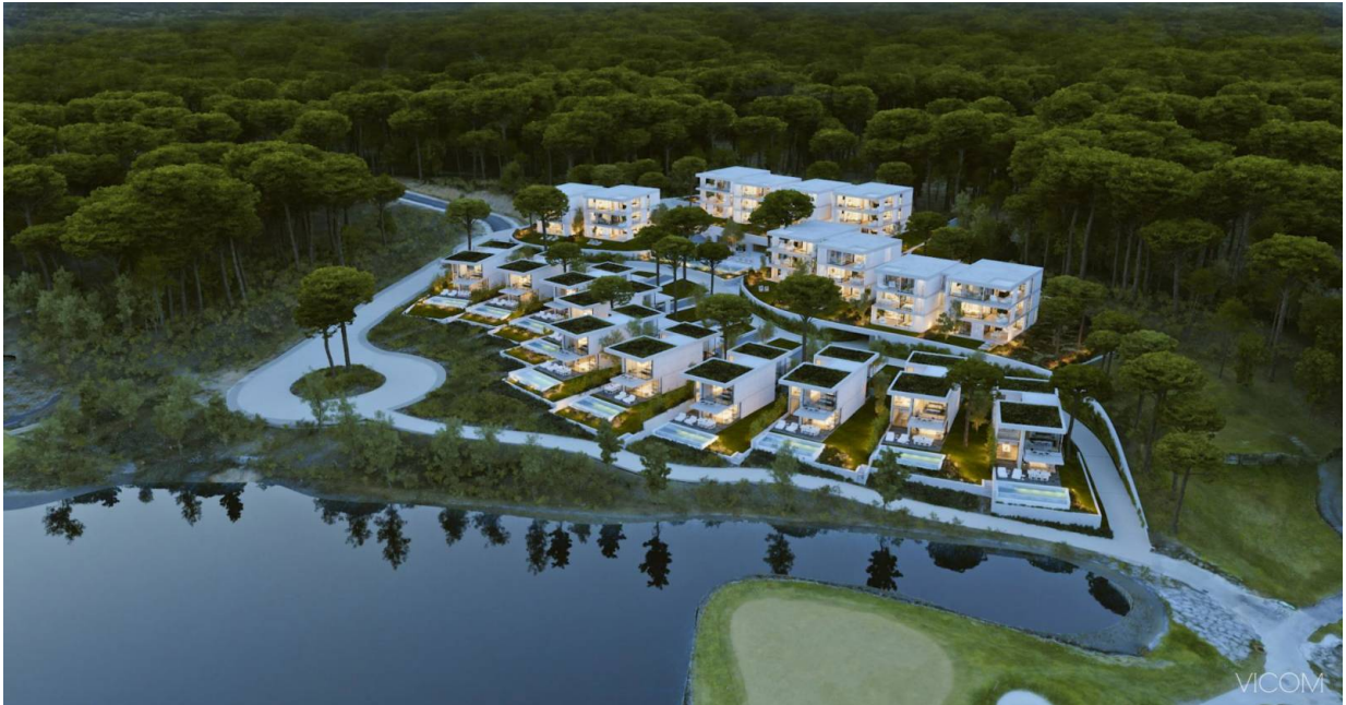
El Bosc Apartments