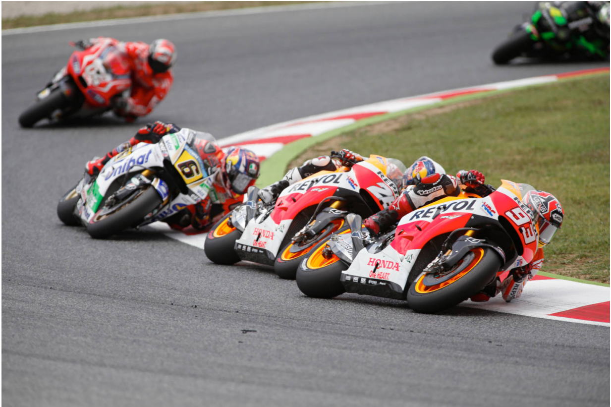
MotoGP 2