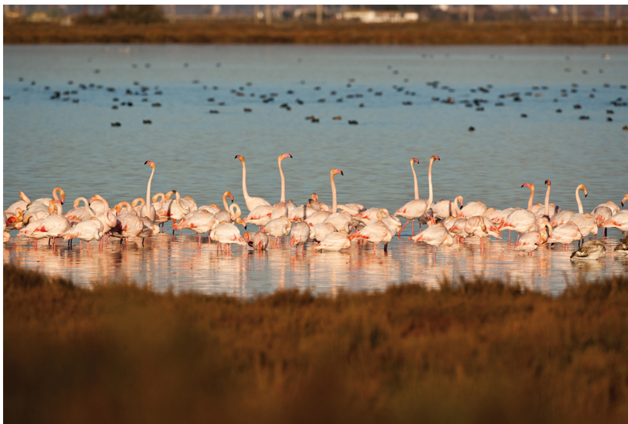
Glamour pur in geschützter Natur: Flamingos am Ebrodelta

Wer MónNatura Delta besuchen möchte, hat die Wahl zwischen verschiedenen interessanten Optionen. Zunächst bietet „Visita MónNatura Delta“ die Möglichkeit, die verschiedenen Räume des Zentrums auf eigene Faust zu erkunden. Auf diese Art können Sie die Magie des Deltas für sich selbst entdecken und genießen. Wer hingegen eine geführte Besichtigung vorzieht, dem sei „Veigues Quin Delta“ empfohlen. Hierbei erkunden Sie alle Räume des Zentrums in Begleitung eines erfahrenen Führers, der Ihnen die Geheimnisse seiner Heimat näherbringt. Schließlich gibt es auch die Möglichkeit, sich MónNatura Delta auf kulinarischem Weg anzunähern. „Un Tastet Del Delta“ ist eine geführte Besichtigung des Zentrums, bei der besonderes Augenmerk auf die gastronomischen Traditionen des Ortes gelegt wird. Zum Abschluss gibt es natürlich einen Aperitif, bestehend aus Spezialitäten aus dem Delta.