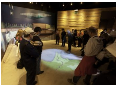
Espai Delta

Espai Delta ist das Interpretationszentrum des Deltas. Es ist das Tor zur Essenz des Deltas, denn es gibt Einblicke in die Traditionen, die Naturschätze und die unterschiedlichen Gesichter des Ortes im Wandel der Jahreszeiten. Überdies ist Espai Delta mit allen technologischen Raffinessen des 21. Jahrhunderts ausgestattet. Audiovisuelle Installationen machen eine Reise in die Vergangenheit des Deltas zu einer nachhaltig sinnlichen Erfahrung. Ein halbgeschlossener Raum dient als Vogelobservatorium mit Blick auf die Laguna de L'Alfacada. Somit sind im Espai Delta auch jenseits der Virtuellen Realität spannende Erlebnisse zu erwarten.