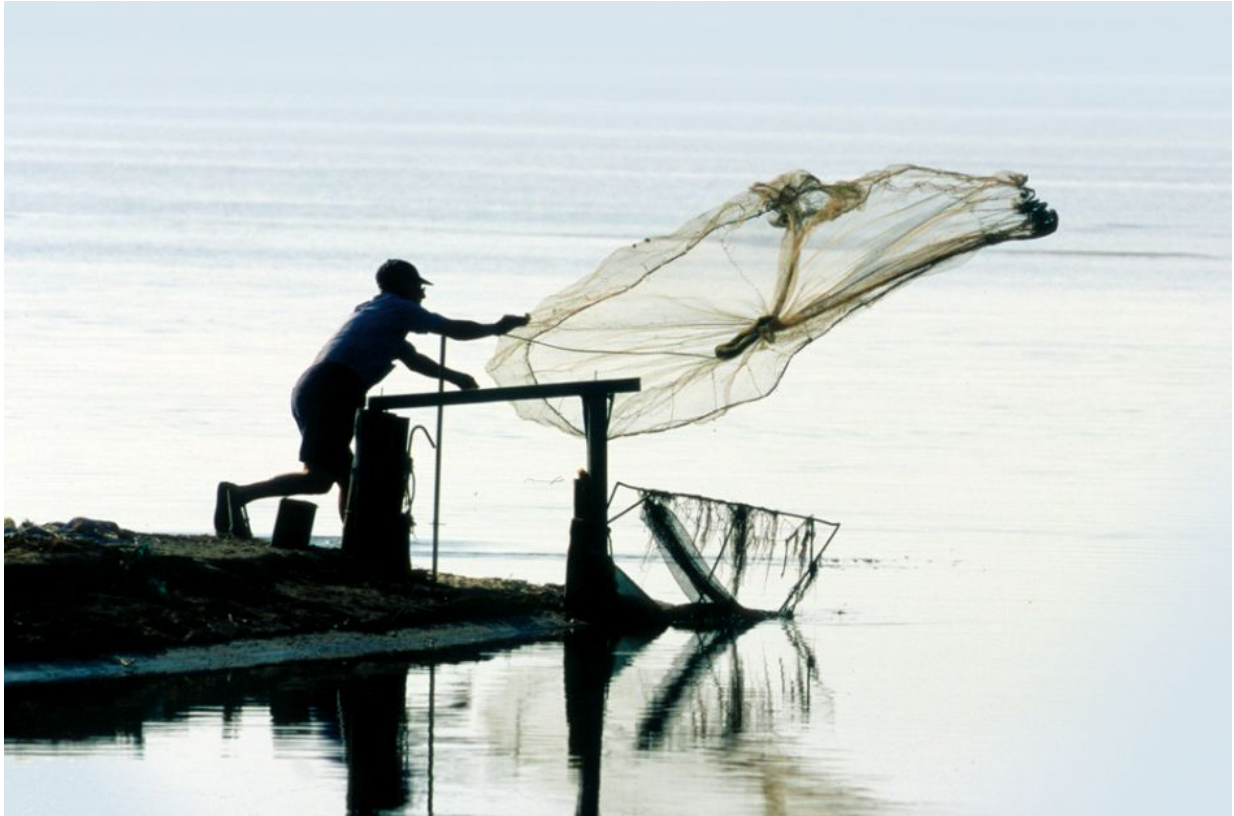
Die Kunst des Fischens im Delta

In den flachen Gewässern navigierten die Bewohner des Deltas traditionell mit Stakbooten. Am Bootssteg von MónNatura Delta kann man auch heute noch diese traditionellen Boote besteigen. Wetten, dass Sie und Ihre Familie viel Spaß bei den Experimenten mit dieser ungewöhnlichen Fortbewegungsart haben?