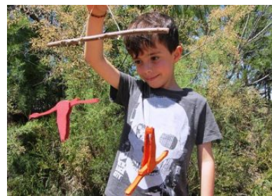
Kinder lieben MónNatura

Ein idealer Ort fürs Birdwatching ist auch das Vogel-Beobachtungshäuschen bei den alten Salinen von Sant Antoni. Hier kann man Sumpfläufer, Fluss-Seeschwalben, Säbelschnäbler und Möwen beobachten. Außerdem gibt es hier Informationen über das Projekt LIFE Delta Lagoon. Dies ist insofern interessant, als das Delta im Zuge des Projektes rekultiviert wurde und deshalb heute eine so fantastische Artenvielfalt aufweist.