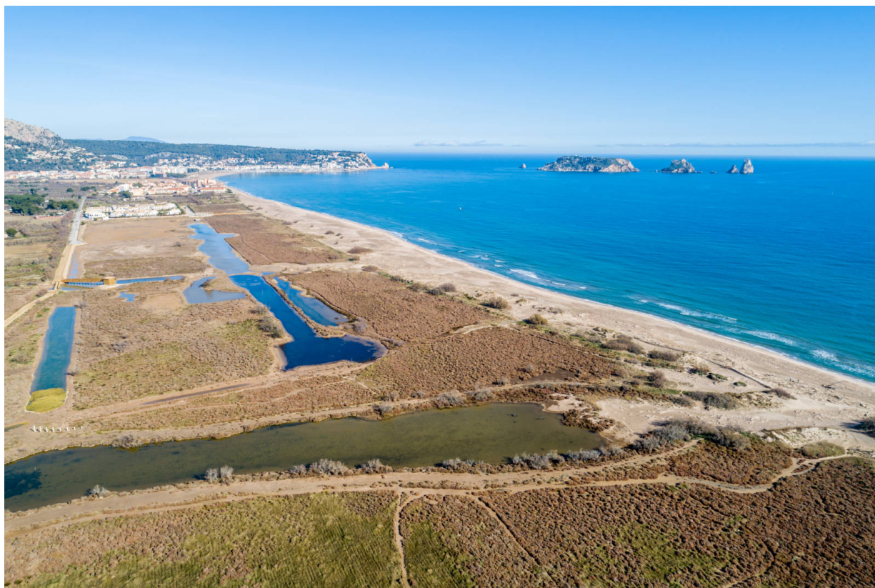
La Pletera heute

Das Projekt La Pletera ist keine isolierte Maßnahme. Es fungiert als Modell, das in Zusammenarbeit mit dem EU-Projekt Life und dem Projekt MEDACC (Adapting the Mediterranean to Climate Change) unter Leitung des katalanischen Büros für Klimawandel durchgeführt wurde. Die im Rahmen des Projektes durchgeführten wissenschaftlichen Studien bilden eine Basis, um den Konsequenzen des Klimawandels zu begegnen.