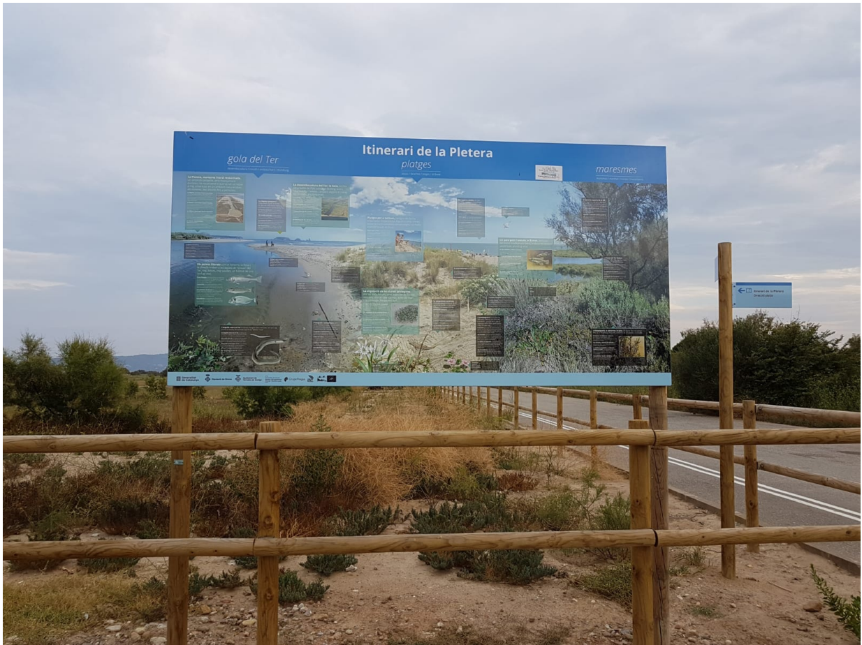
Schautafel zum Projekt Life Pletera

Die Renaturierung der Pletera, macht das Gebiet nicht nur für Menschen, sondern auch für Vögel wieder attraktiv. Seit kurzem sind in einer der Lagunen des öfteren zwei Flamingos anzutreffen. Diese sind derzeit die „Stars“ der Pletera, die bei der lokalen Bevölkerung echte Begeisterung auslösen. Die Experten hoffen, dass innerhalb der nächsten Jahre hier wieder viele Wasservögel heimisch werden.