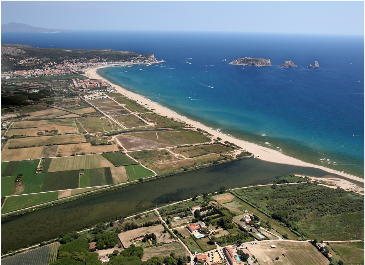
Luftaufnahme von L'Estartit von 2012