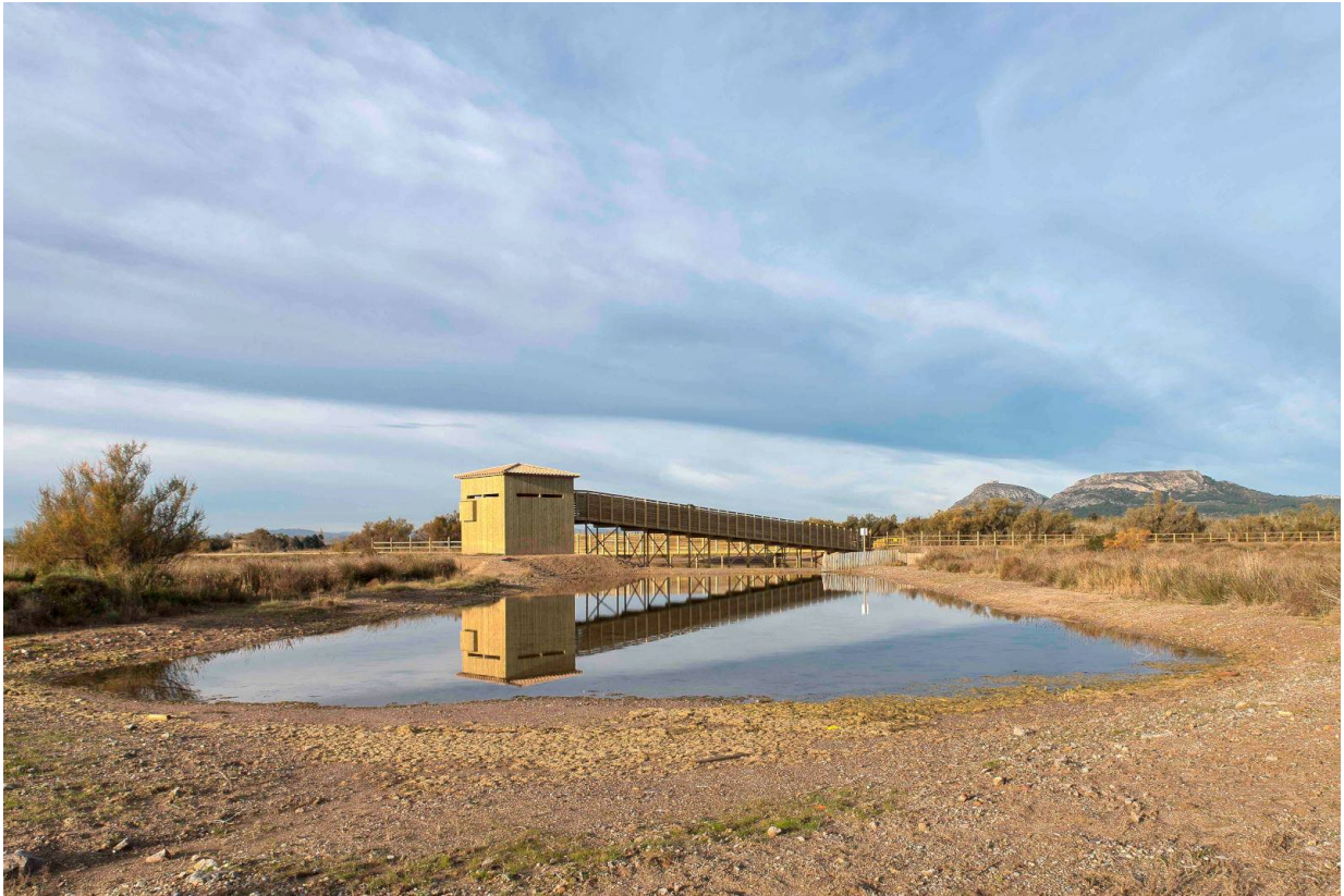
Beobachtungsstand im Espai Pletera

Einen Beitrag über die Highlights eines Urlaubs in in Torroella de Montgrí-L'Estartit finden Sie hier . Infos zum Aktivurlaub im Naturpark Torroella de Montgrí, Medas-Inseln und Baix Ter gibt es hier .