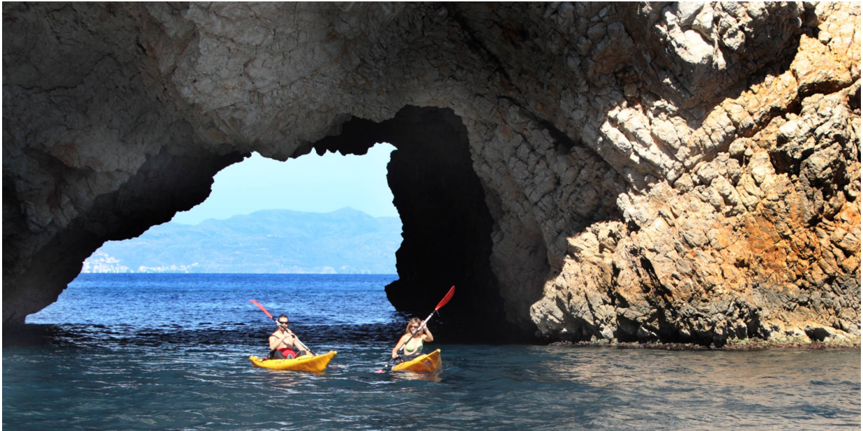
Kayak-Tour bei L'Estartit