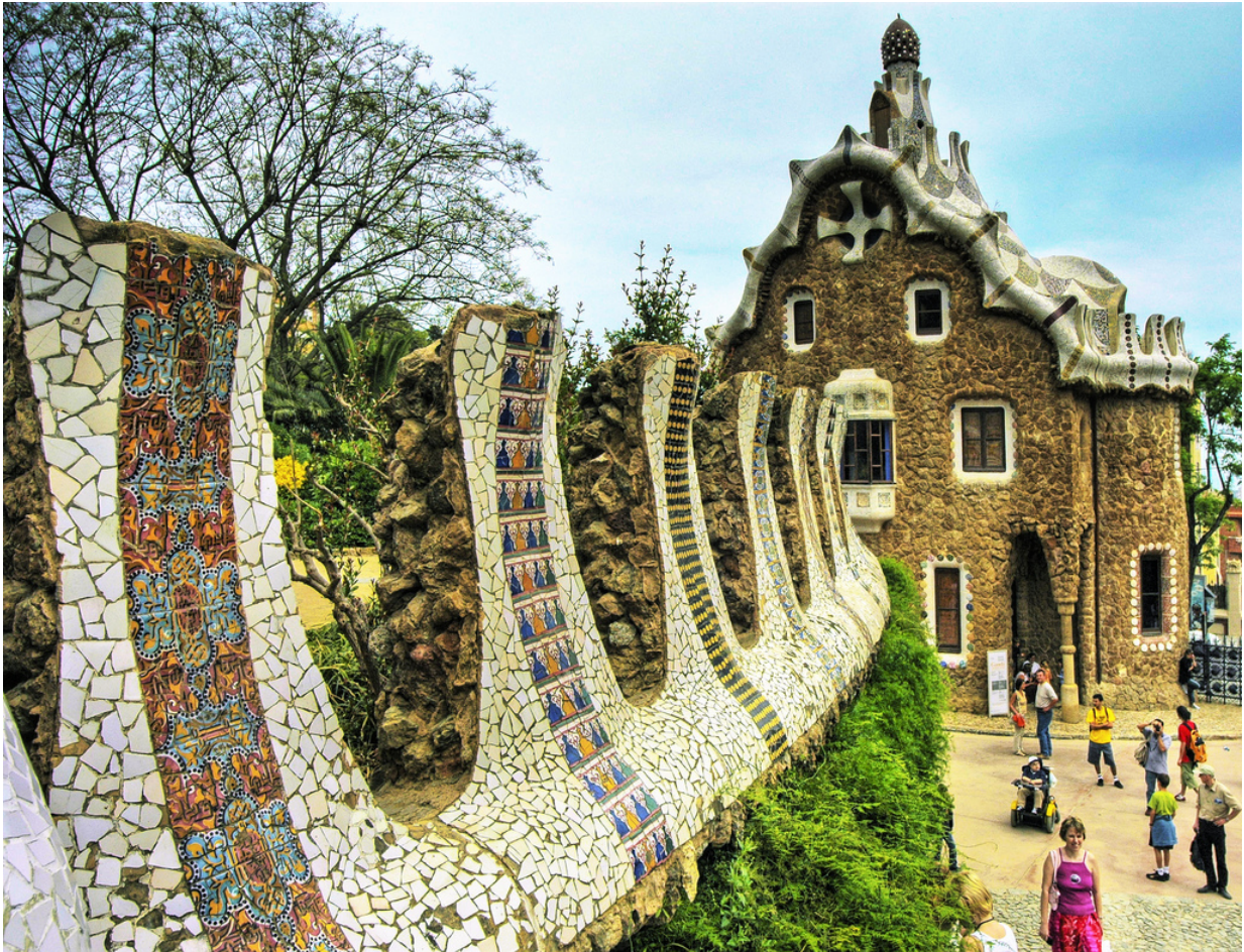
Park Güell. Foto: Wolfgang Staudt auf Flickr. Lizenz: CC BY 2.0