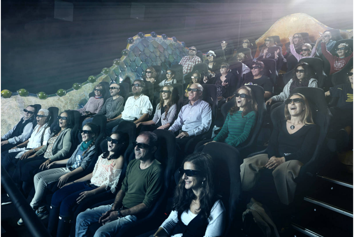
Virtuelle Realität in Action.