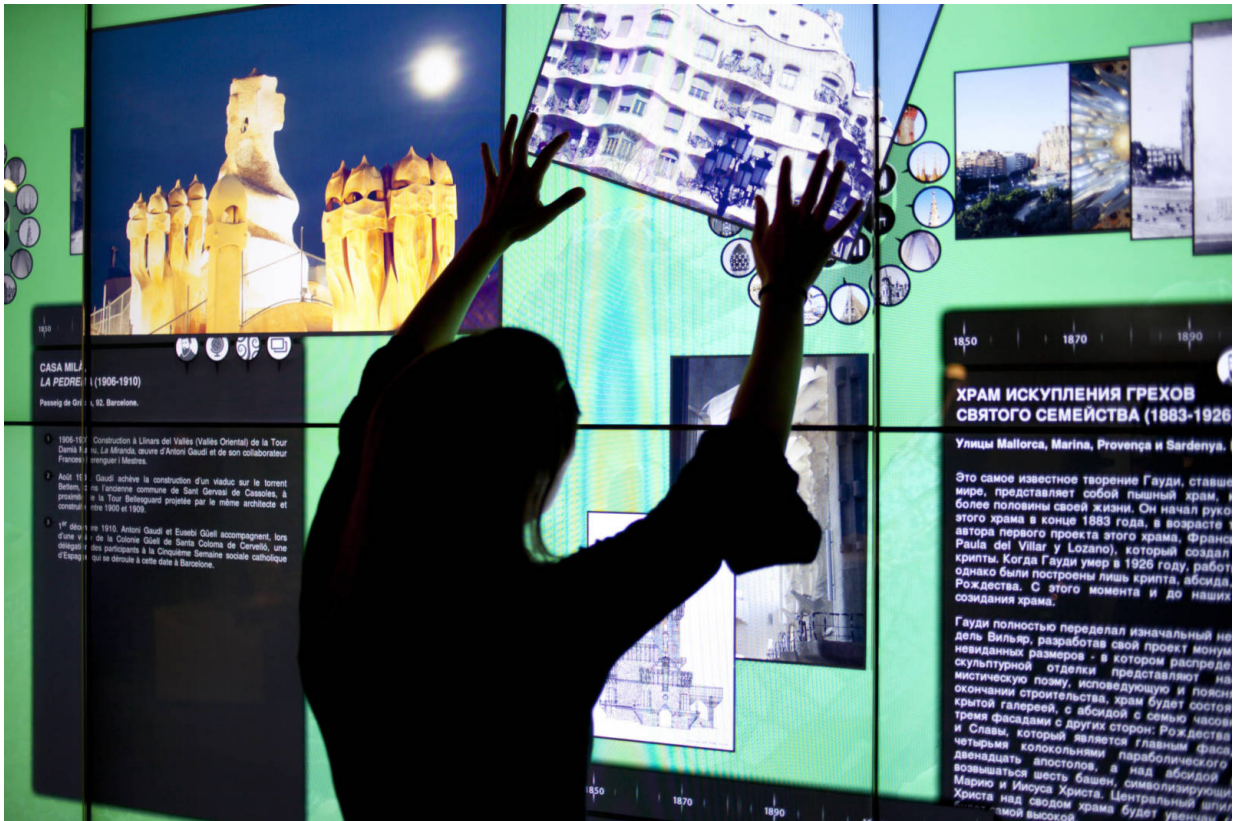
An interaktiven Bildschirmen erkunden die Besucher die Welt Gaudís.