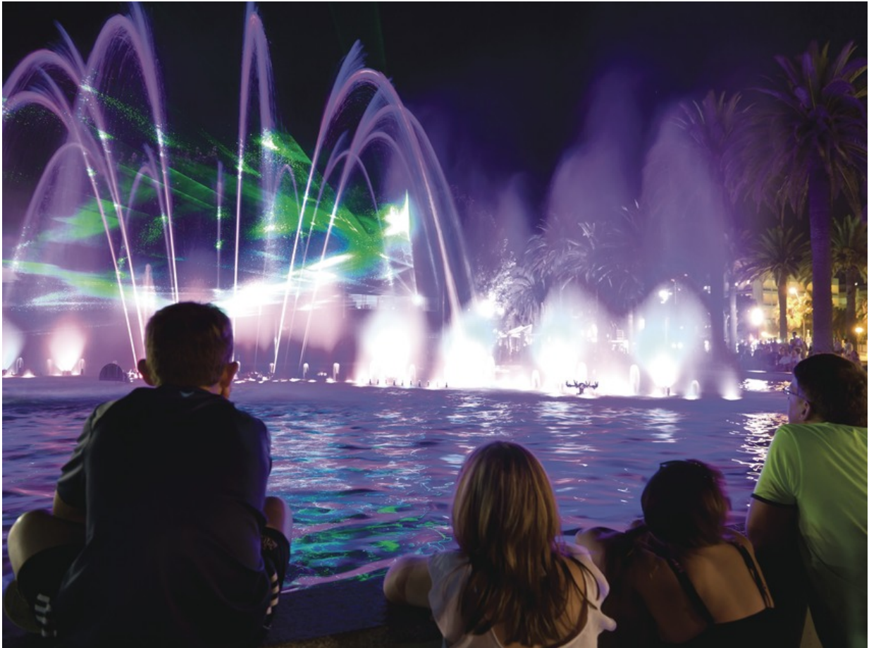
Salou, die Stadt der Springbrunnen