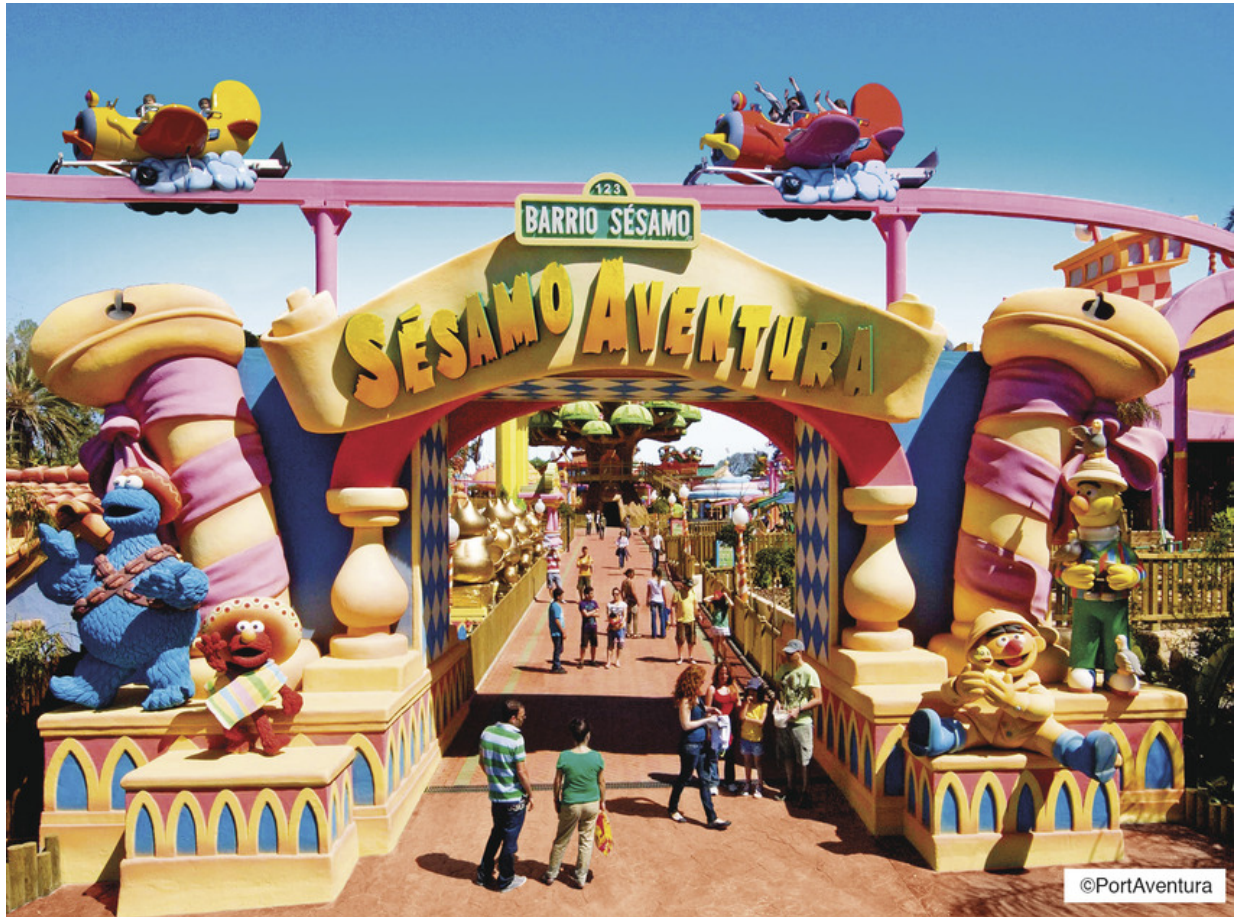
SesamoAventura an der CostaDaurada

Port Aventura ist der wohl berühmteste Themenpark der Costa Daurada. Er wimmelt nur so von Attraktionen, großen Emotionen und Spaß für Groß und Klein in unterschiedlichen Themenwelten. Doch auch für Momente der Entspannung ist hier gesorgt. Im Port de la Drassana im Themenbereich Mittelmeer, kann man auf ein Schiff steigen und eine Rundfahrt durch den Freizeitpark genießen. – Ideal um den jüngsten Familienmitgliedern ein bißchen Zeit zum Verschnaufen zu geben oder einfach mal die Füße auszuruhen. Infos gibt es hier .