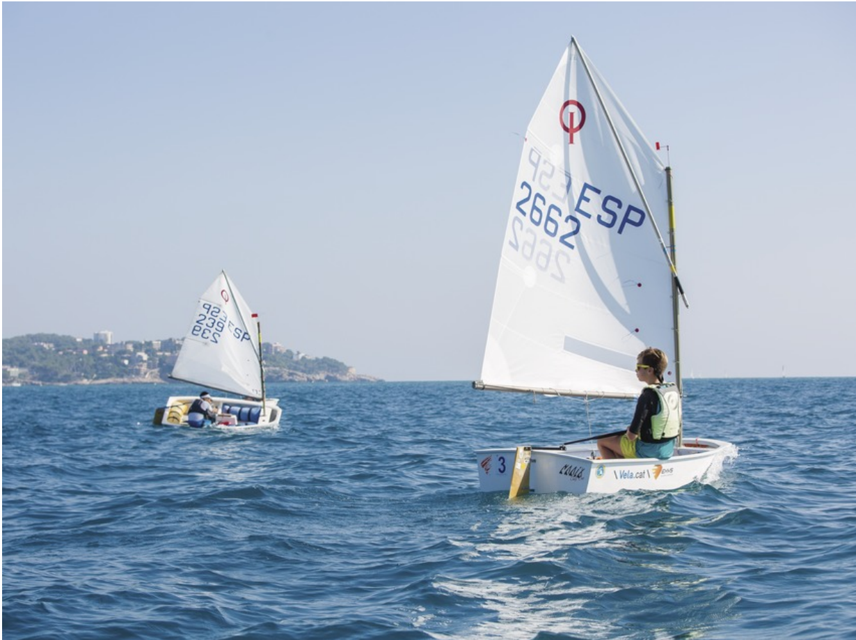
Segeltörn an der Costa Daurada