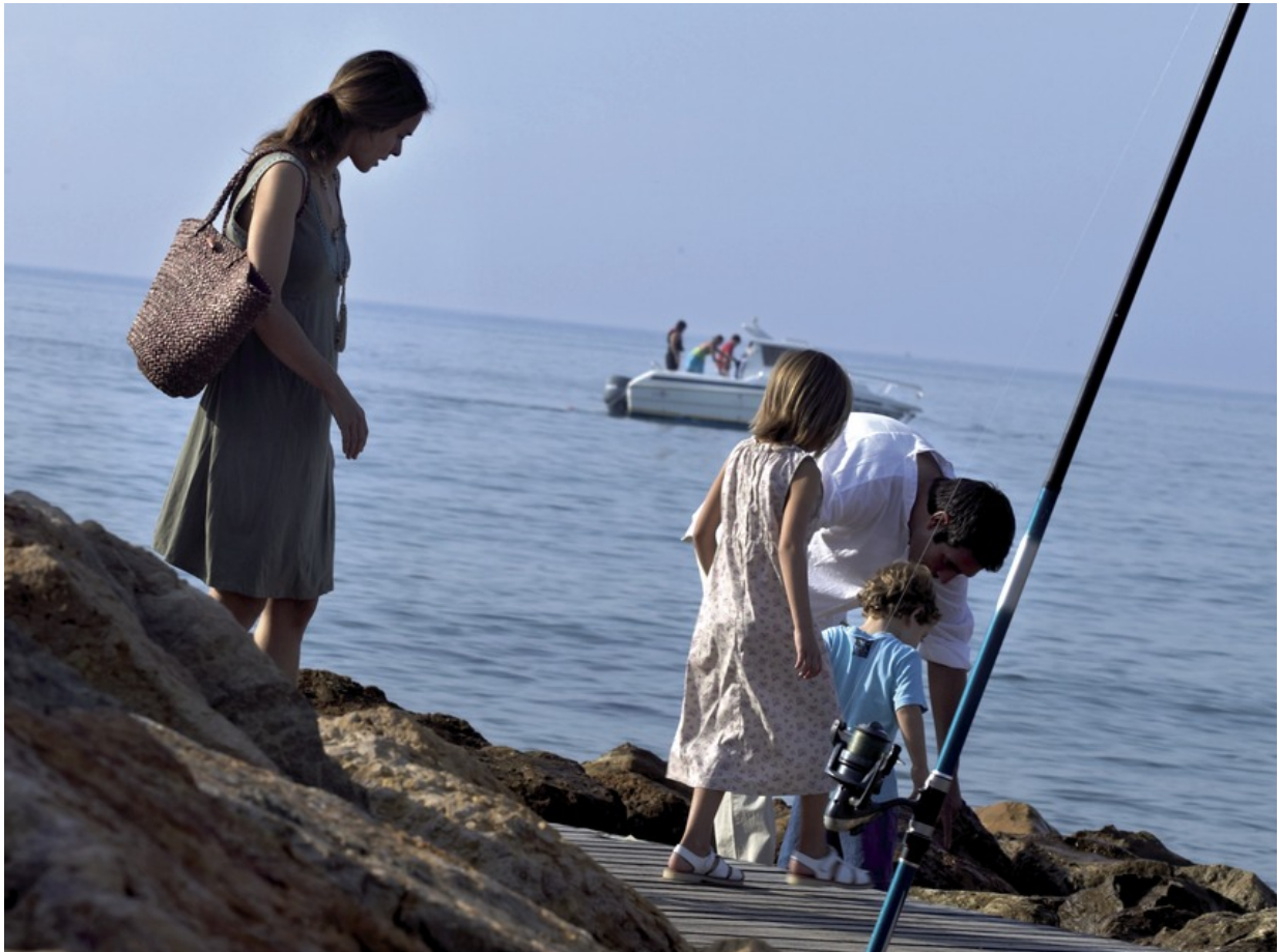
Der Küstenweg von Salou

Salou ist ein zertifiziert familienfreundliches Urlaubsziel und hat sein Angebot insbesondere auf die Wünsche und Bedürfnisse seiner kleinen Gäste ausgelegt. Das merkt man nicht erst in den familienfreundlichen Unterkünften und Restaurants, sondern schon bei einem Spaziergang über die Strandpromenade mit ihren vielen Kinderspielplätzen. Ein Highlight für die ganze Familie ist ein Spaziergang über den Küstenweg von Salou. Er verläuft auf Holzstegen, so dass man beim Laufen praktisch über dem Meer schwebt. Der Küstenweg führt zu den wunderschönen Stränden und Buchten von Salou. Wer den Spaziergang im Abendsonnenlicht macht, begreift schnell woher die „Goldene Küste“ – Costa Daurada ihren Namen hat.