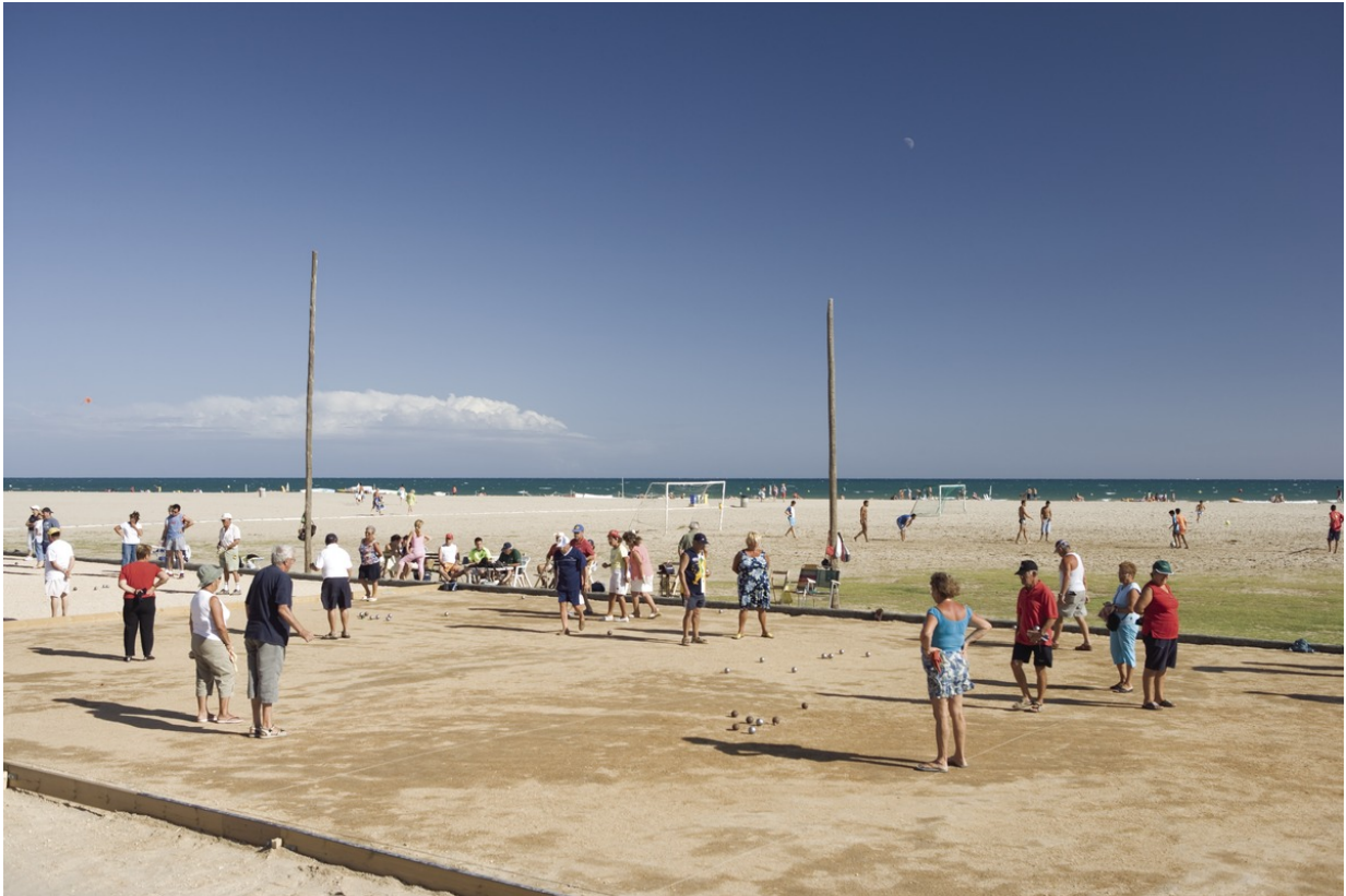
Strand von Calafell

geschichtsträchtige Stadt im Herzen des Baix Penedès lockt nämlich auch mit einem fünf Kilometer langen, goldsandigen Strand. Außerdem ist sie als familienfreundliches Urlaubsziel zertifiziert. Feiner Sand, kristallklares Wasser und bunte Segelboote zieren die typischen Postkarten aus Calafell. Genauso kann man den Strand auch selbst erleben. Alles, was man braucht ist Zeit und Muße. Für kindgerechtes Strandvergnügen vom Segeltörn bis zur Cayaktour ist schon gesorgt. Infos gibt es hier .