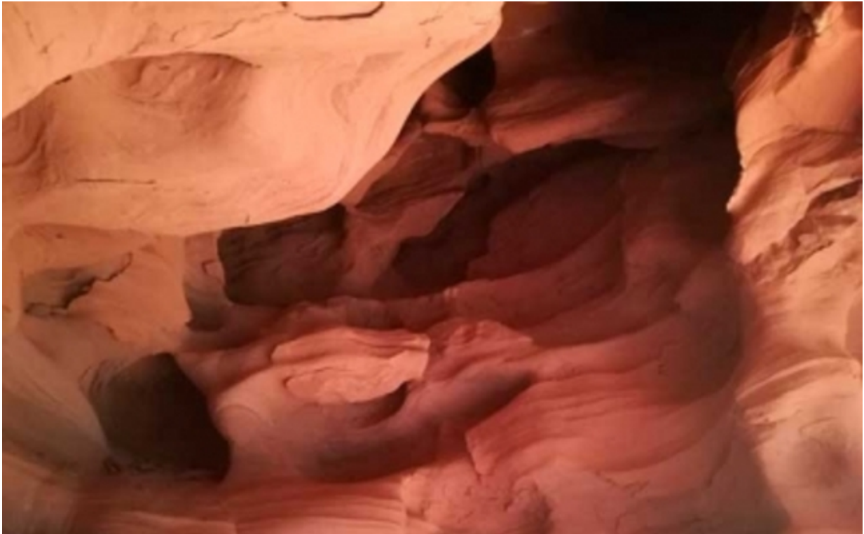
Coves Can Riera

Zwar liegen die Covas de Can Riera nur 20 Minuten von Barcelona entfernt, doch ist für die Anfahrt ein Auto nötig. Ausgangspunkt ist das Centre d'Esports Municipal de Can Roig. Von hier aus folgt man der Markierung Richtung Collet de Can Riera. Es gibt einige Hindernisse zu überwinden, wie umgestürzte Bäume und beträchtlich Höhenunterschiede, bis man schließlich auf eine Metalleiter trifft. Diese führt zur zweiten und dritten Höhe von Can Riera, die wahrhaft beeindruckend sind.