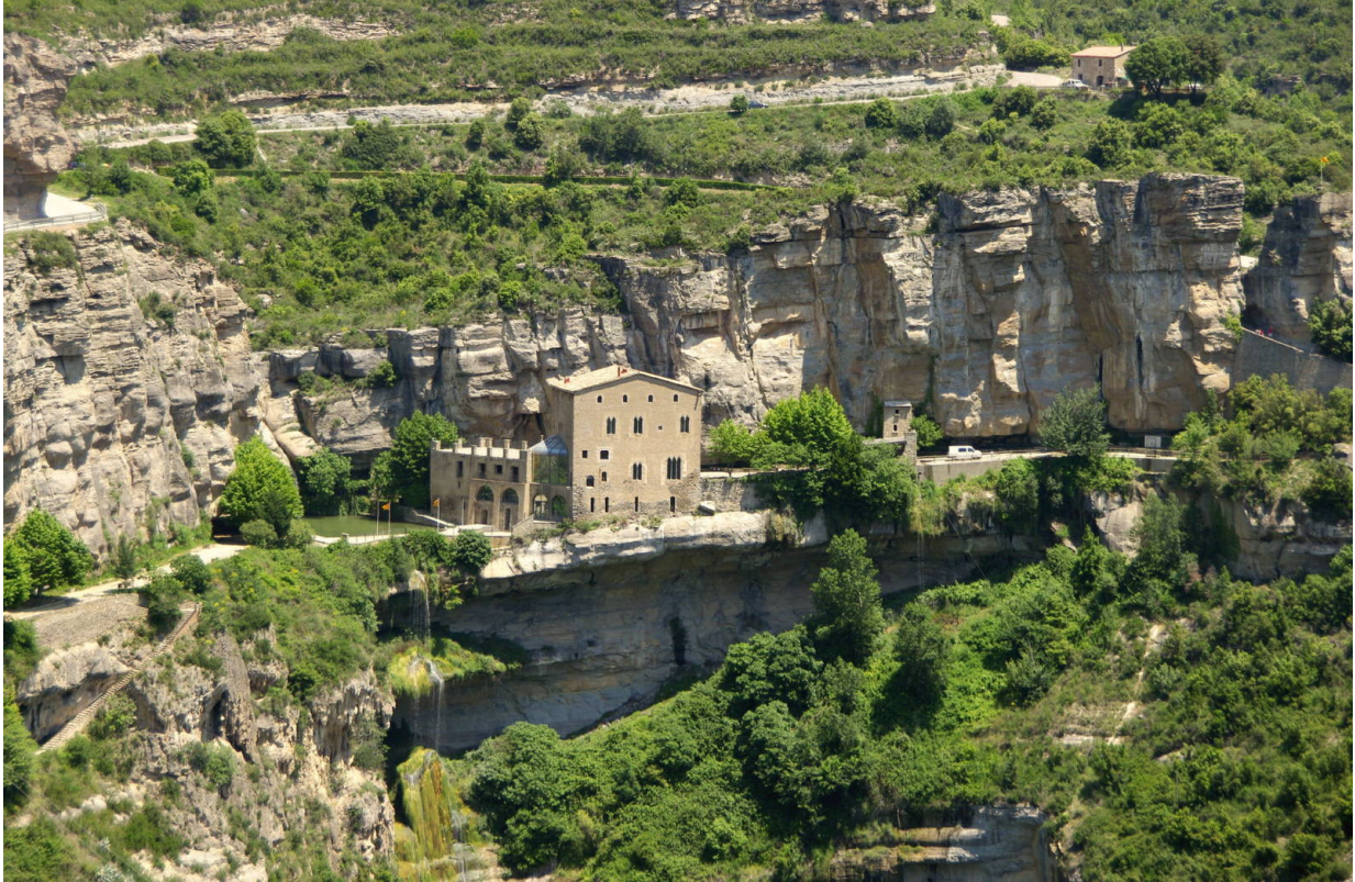
Sant Miquel de Fai.

Die Route beginnt in Riells de Fai, wo man das Auto auf einem kostenfreien Parkplatz abstellen kann. Von dort aus gelangt man in etwa zehn Minuten zur Riera de Tenes, einem der beeindruckendsten Wasserfälle des Gebietes. Dies ist der eigentliche Startpunkt der Tour, auf der man in etwa einer Stunde das Heiligtum erreicht. Zu den Höhepunkten dieses Ausflugs zählt der Besuch der romanischen Kapelle Sant Miquel, die als einzige Kataloniens in eine Höhle hineingebaut ist.