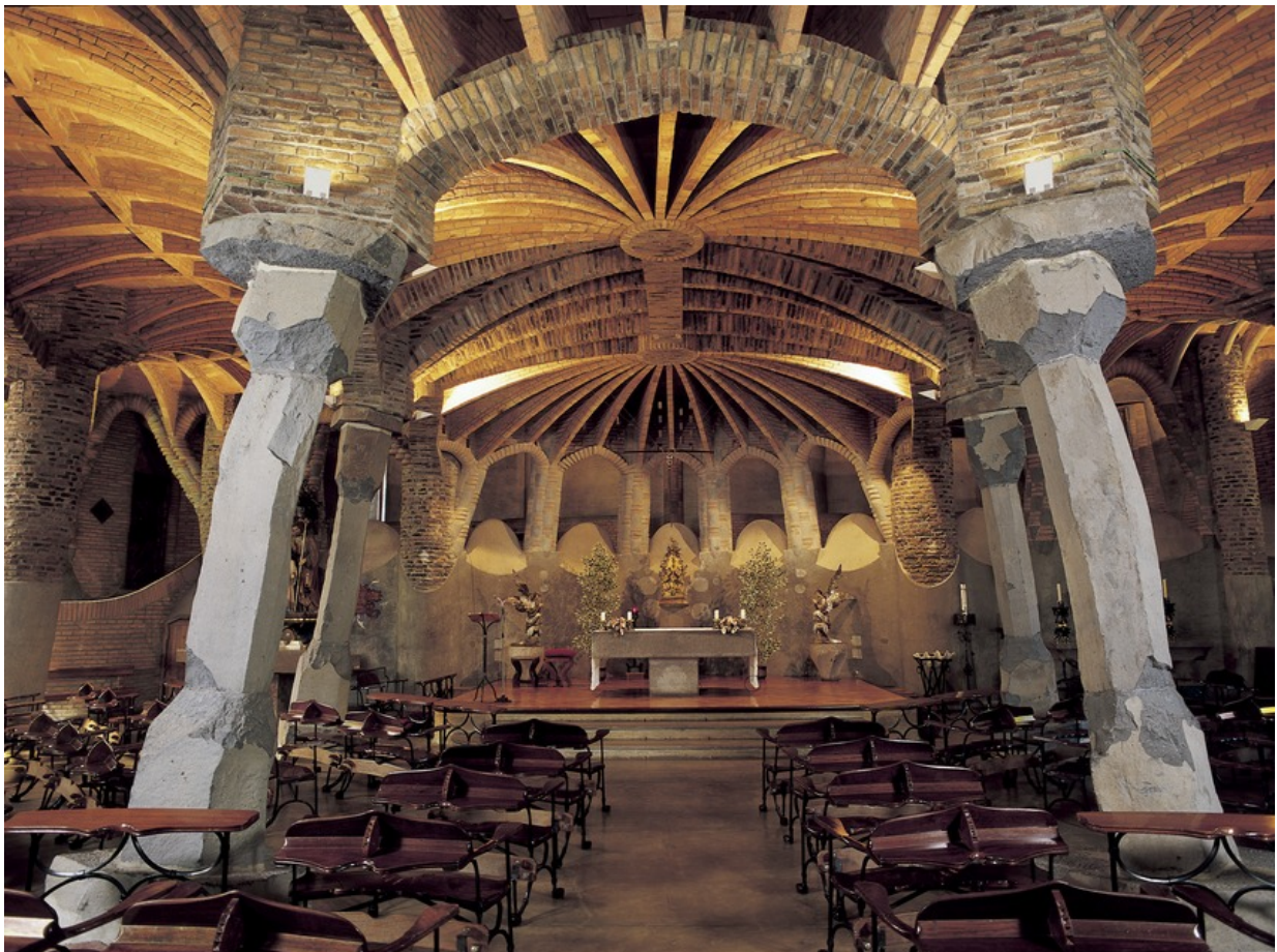
Krypta der Colònia Güell

“Barcelona ist viel mehr”. Mit diesem Slogan macht die Provinz Barcelona auf die facettenreichen Erlebnismöglichkeiten rund um die katalanische Metropole aufmerksam. Jenseits des touristischen Mainstreams kann man hier in aller Ruhe wahre Perlen authentisch katalanischer Kultur und Natur entdecken. Falls Sie also eine kurzfristige Auszeit vom Buzz von Barcelona City suchen und Lust auf eine kleine Wanderung haben, ist dieser Beitrag für Sie. Wir stellen Ihnen fünf familientaugliche Wanderungen in der Provinz Barcelona vor. Freuen Sie sich auf überraschende, zauberhafte und tiefenentspannte Kultur- und Naturerlebnisse rund um Barcelona.