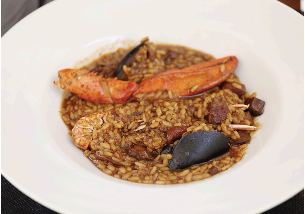
Traditionelles Gericht der Region: Arròs de Pals