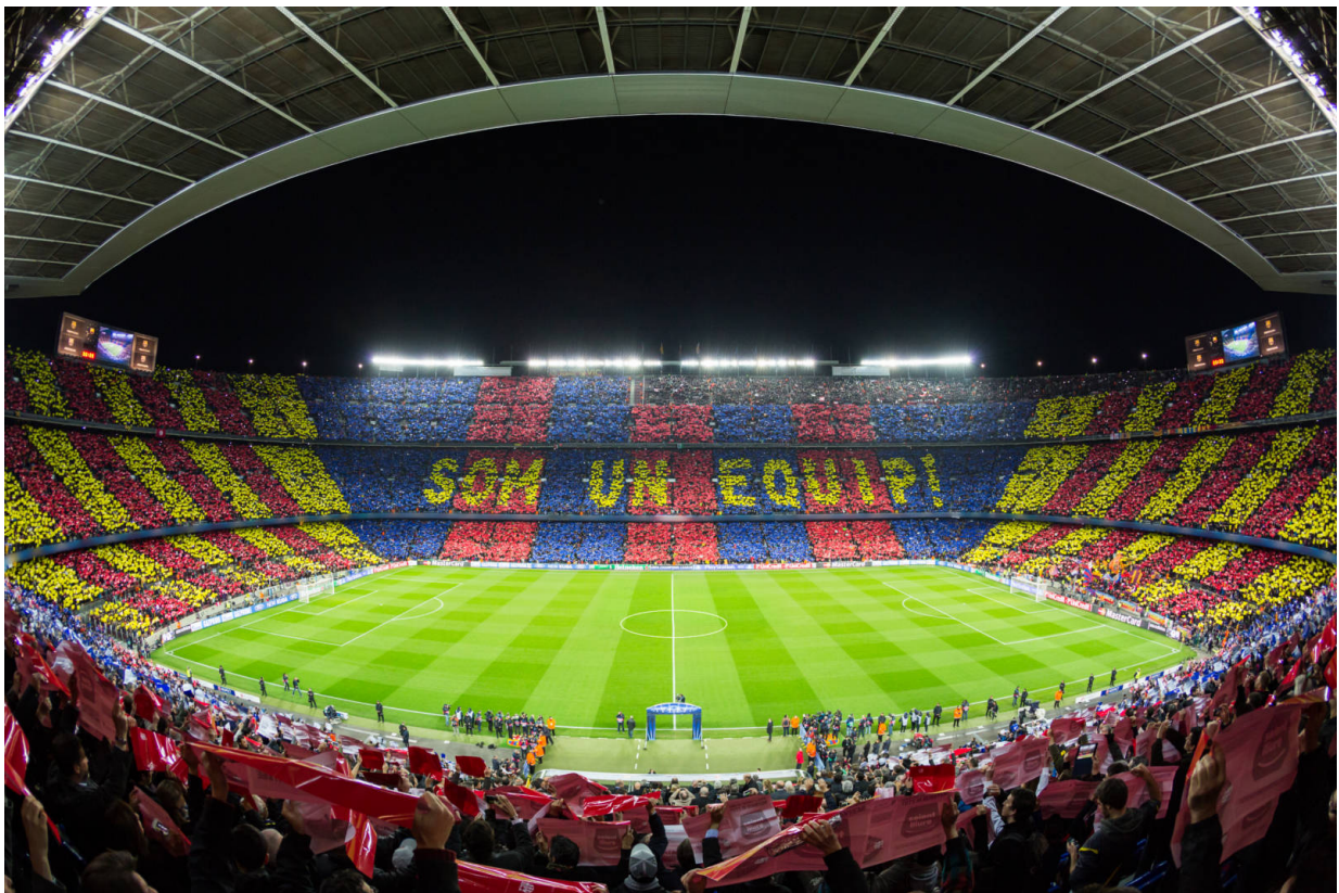
Barça – „som un equip!“

„Mehr als ein Verein“ lautet das Motto des FC Barcelona. Der auch kurz und liebevoll „Barça“ genannte Futbol Club Barcelona ist DAS sportliche Symbol katalanischer Identität. Der legendäre Club hat einige Fußball- Wunder vollbracht. So war der Barça der erste Fußballclub, der es schaffte, sechs Titel in einer einzigen Saison zu holen. 2009 gewann der Barça die spanische Meisterschaft, die Copa del Rey, die UEFA Champions League, den UEFA Super Cup, die Supercopa de España und die FIFA Klub-Weltmeisterschaft. Der Verein definiert sich jedoch nicht nur über fantastischen Fußball, sondern auch über sein soziales Engagement. Dies in Verbindung mit den charakterstarken Spielern des Teams hat dem Barça Fans in ganz Europa eingebracht.