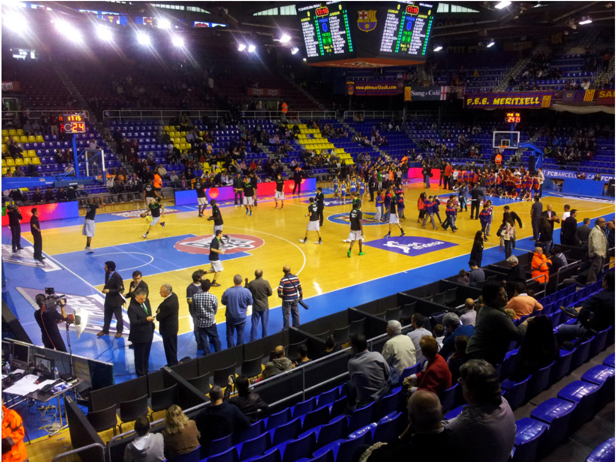
Palau Blaugrana