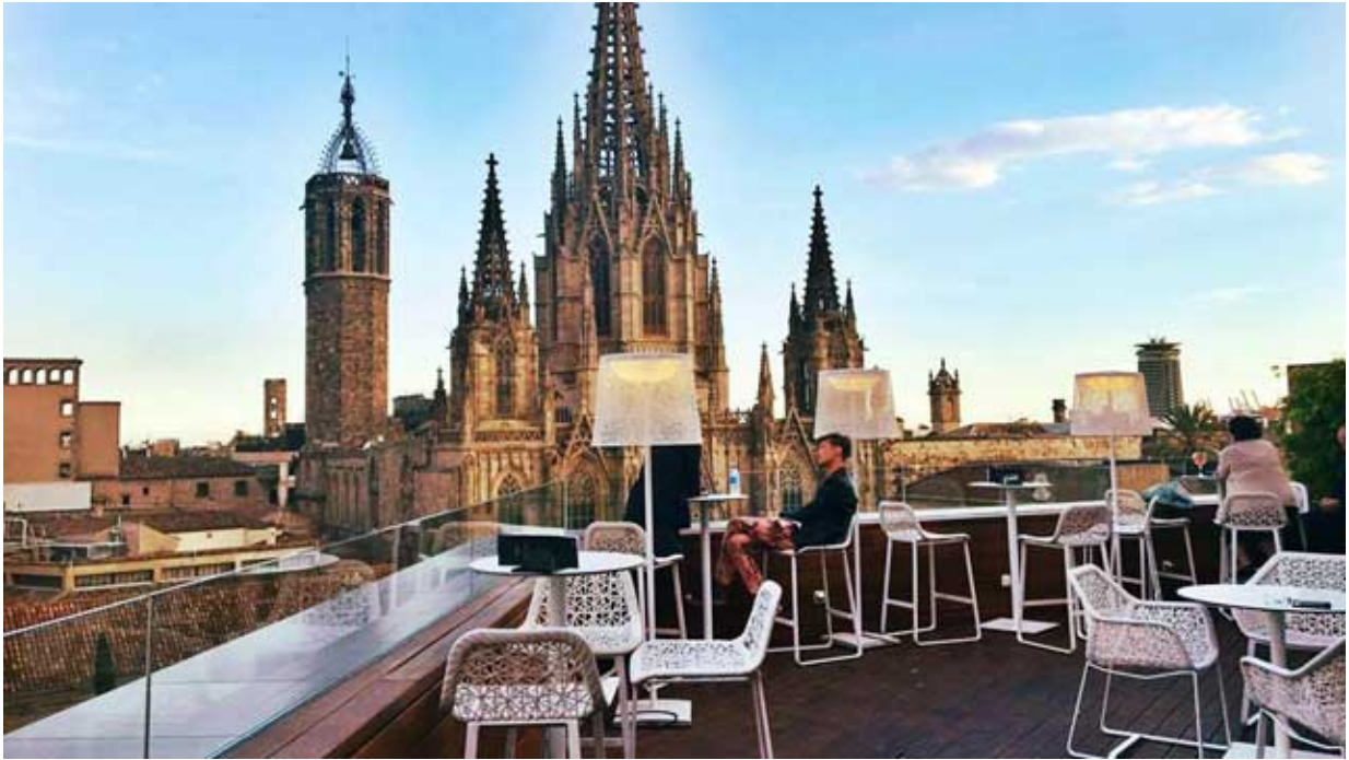
Panorama-Terrasse Hotel Colón

Adresse: Av. de la Catedral, 7, 08002 Barcelona