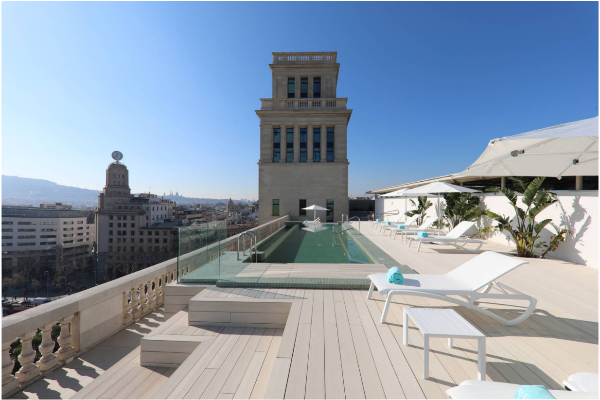
Skybar am Passeig de Gràcia

Adresse: Iberostar Paseo de Gracia, Plaza Cataluña, 10 08002 Barcelona