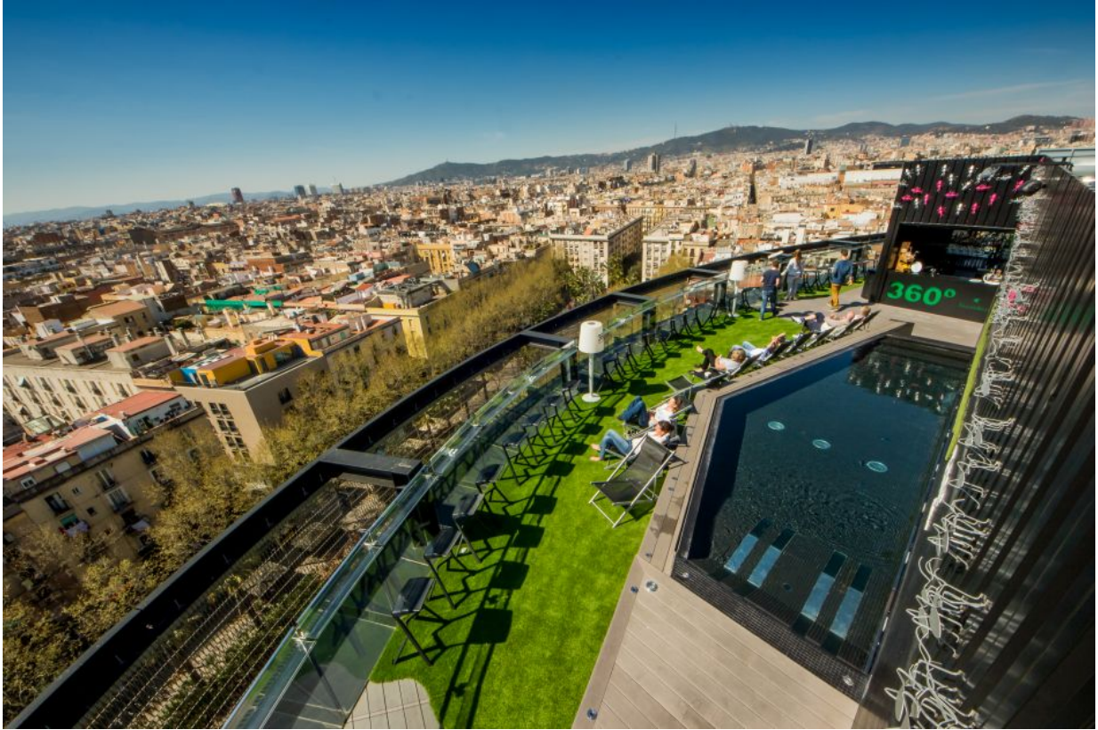
360°-Terrasse – Hotel Barceló Raval

Adresse: Rambla del Raval, 17-21 08001 Barcelona (Ciutat Vella)