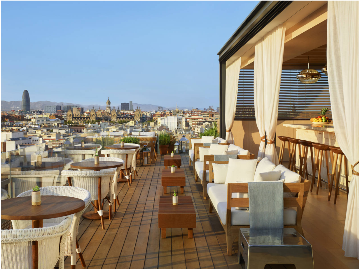
The Roof – Barcelona Edition

Adresse: Av. de Francesc Cambó, 14 – 08003 Barcelona (Ciutat Vella)