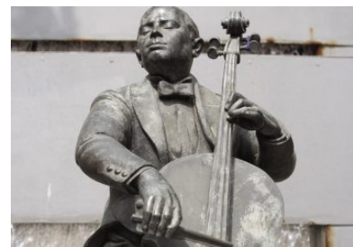
Pau Casals