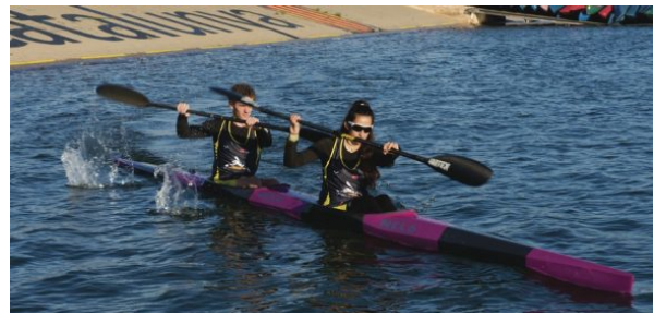
Canal Olímpic de Catalunya