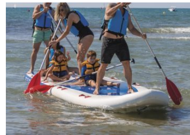
SUP in Vilanova