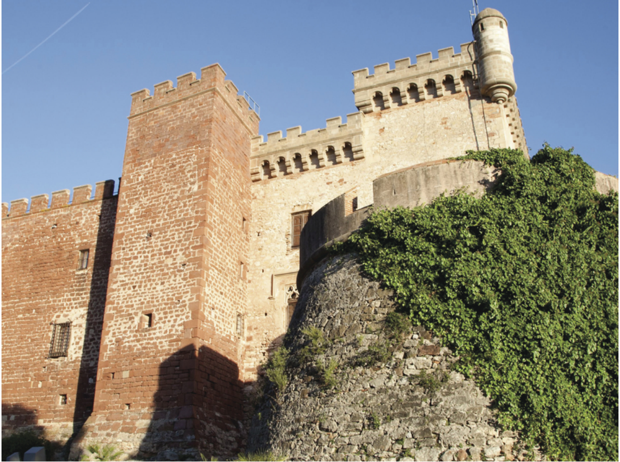
Burg von Castelldefels