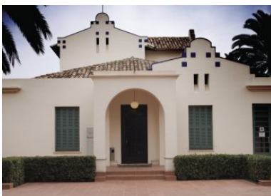
Haus Pau Casals

Pau Casals war ein großer Cellist, ein berühmter Friedensaktivist und eine der faszinierendsten Persönlichkeiten des 20. Jahrhunderts. Seinen Wohnsitz hatte Pau Casals über viele Jahre in El Vendrell. Der Küstenort mit den jodhaltigen Stränden ist heute als familienfreundlicher Urlaubsort zertifiziert. Überdies hütet er aber auch das Pau Casals Museum. Dies ist leicht zu erreichen und überdies ein perfekter Ort, um auch die Kleinsten in die Welt der Musik einzuführen. Man kann die Instrumente des Komponisten bewundern, durch die noch intakten Räume des Hauses wandeln, und der Musik Pau Casals lauschen. Weitere Infos gibt es hier .