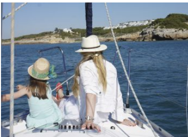
© Ajuntament de Vilanova i la Geltrú

Ein besonders schönes Erlebnis für die ganze Familie ist eine Segeltörn mit Kapitän von Vilanova i la Geltrú bis nach Sitges. Den Blick auf die Küste von der See aus zu genießen und sich dabei die frische Meeresbrise um die Nase wehen zu lassen, ist für Kinder und erwachsene ein tolles Erlebnis. Infos gibt hier .