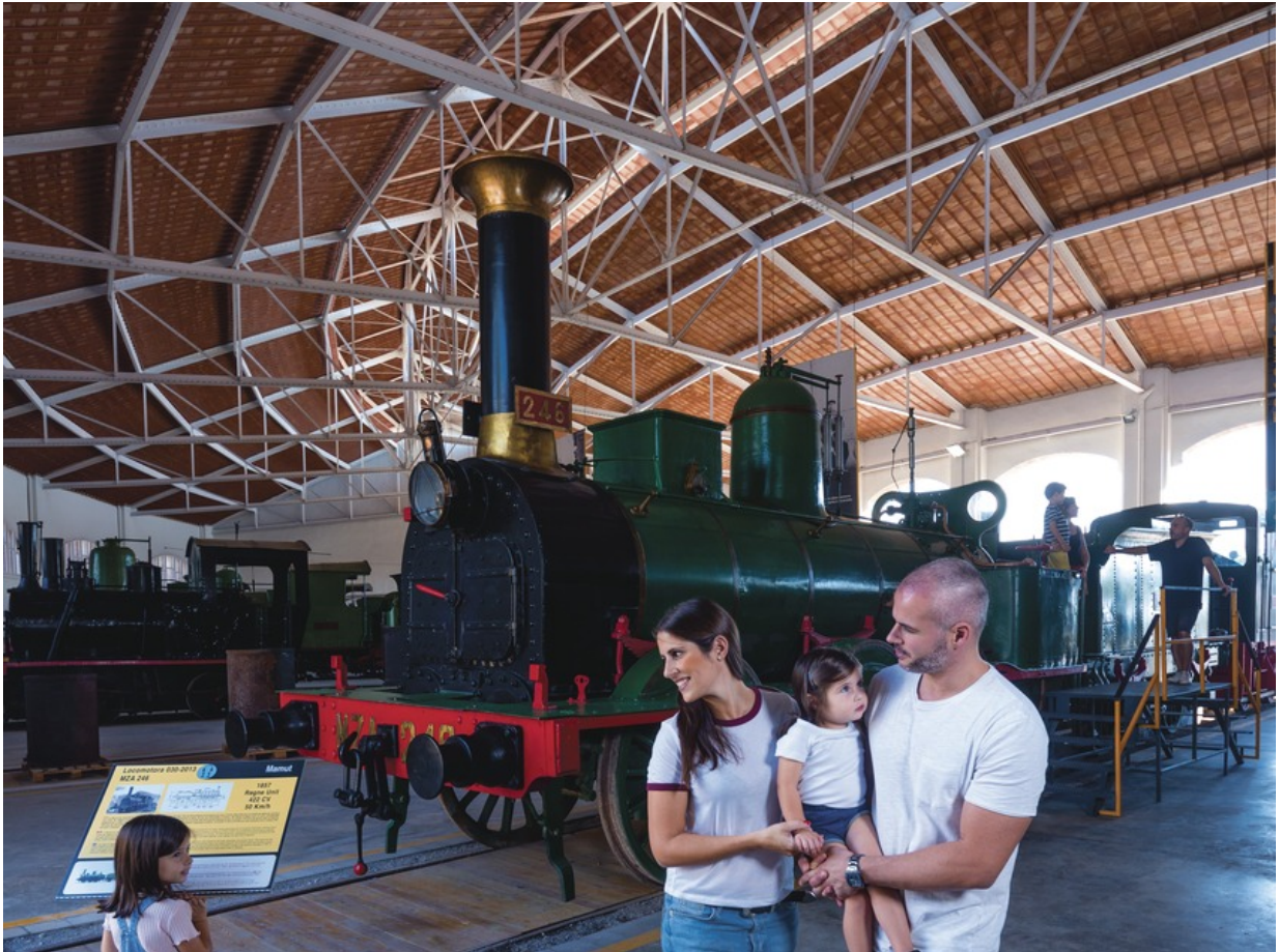
Museu del Ferrocarril