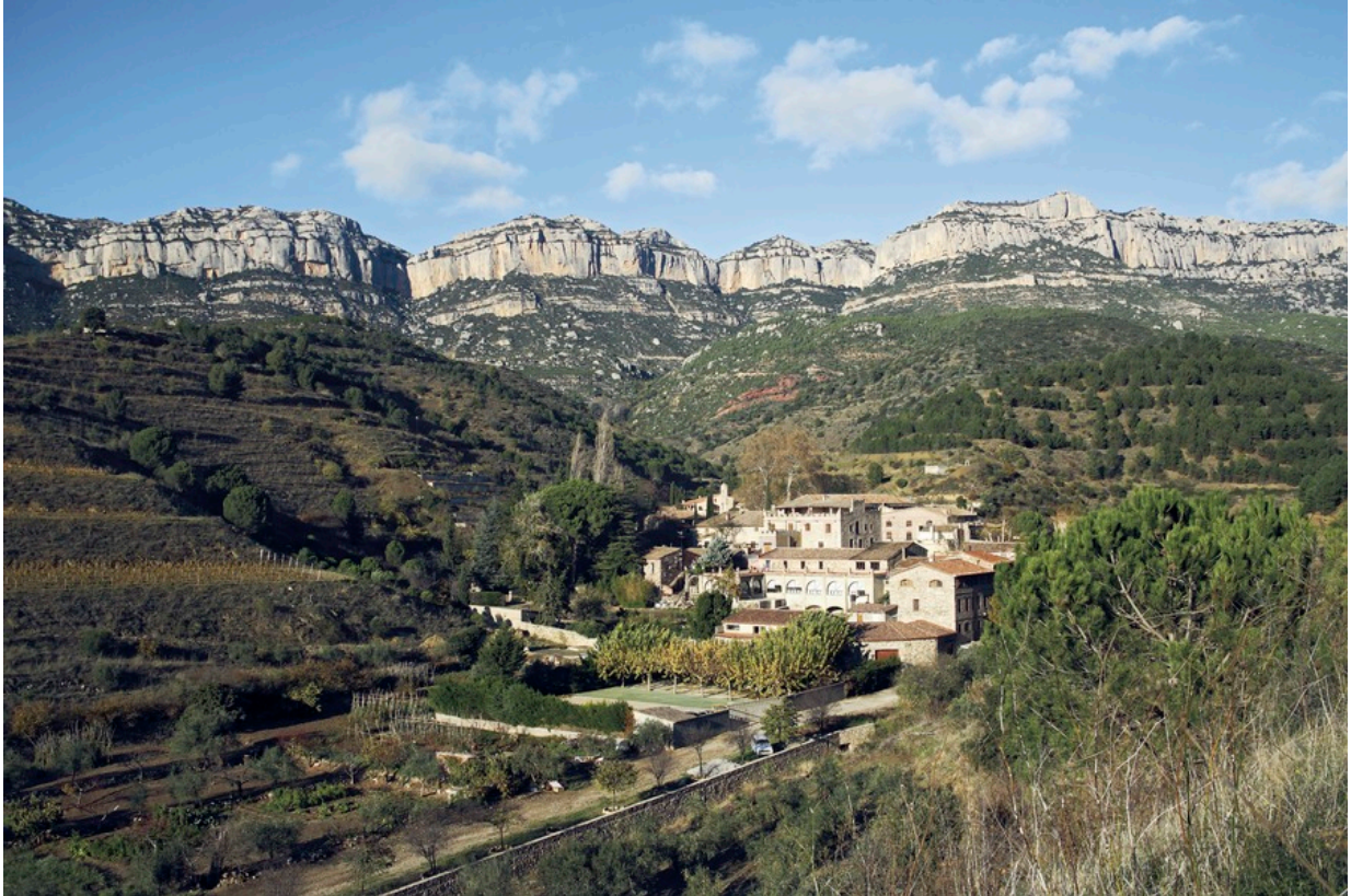
Blick auf die Gemeinde Escaladei im Naturpark der Serra del Montsant