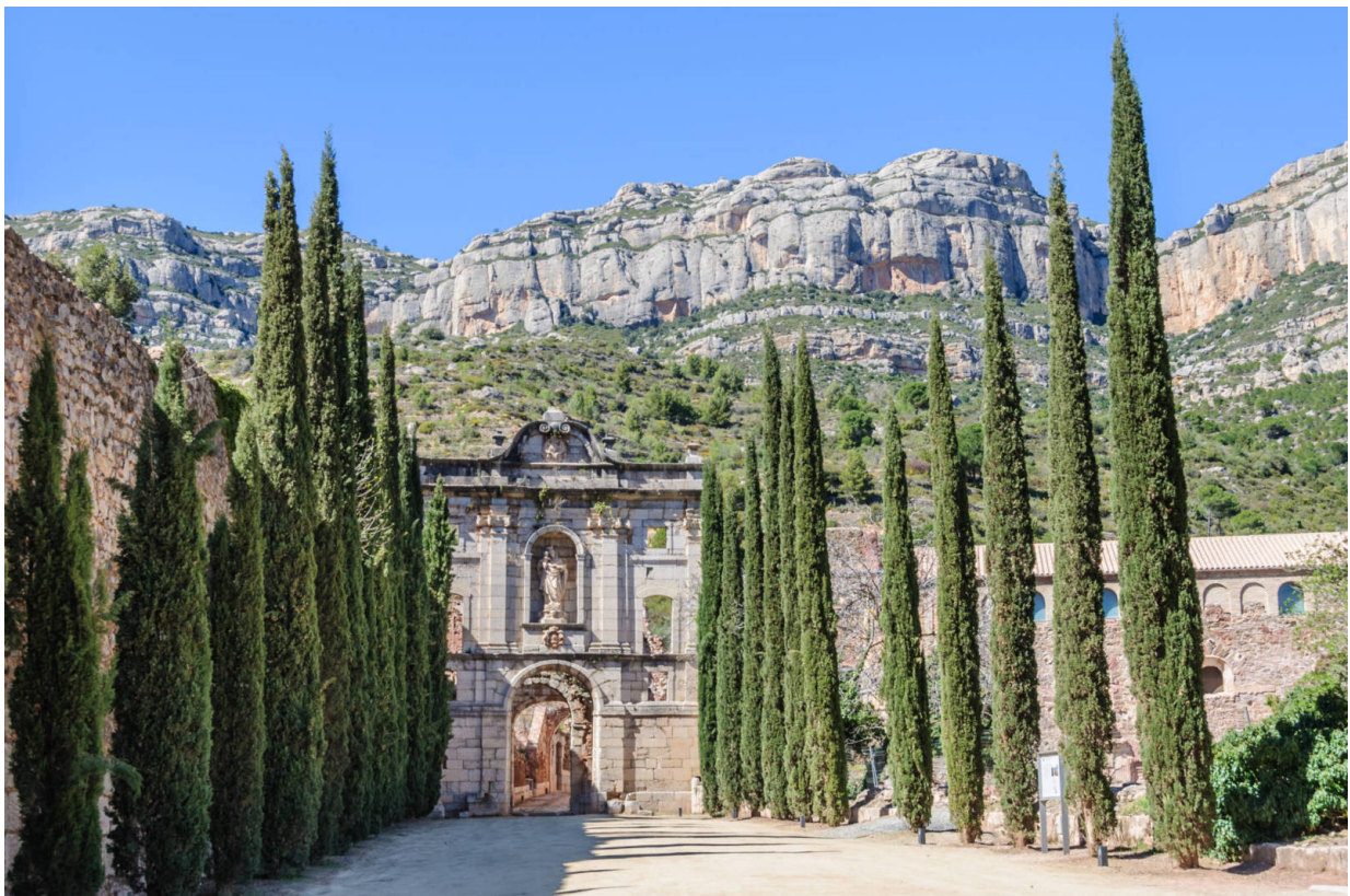
Kataloniens ältestes Kartäuserkloster: Santa María d'Escaladei

Für Reisende ist der Priorat bislang noch ein Geheimtipp, internationale Weinkenner haben die Gebirgsregion im Hinterland der Costa Daurada jedoch schon seit einigen Jahren genau im Blick. Der Priorat ist eine von zwei Weinbauregionen, die den Standards der höchsten spanischen Qualitätsauszeichnung DOC (denominación de origen calificada) entspricht. Die Wurzeln der Weinkultur des Priorat reichen weit zurück in die Vergangenheit. Ihren Ausgangspunkt haben sie in einem uralten Kartäuserkloster, der Cartoixa de Santa Maria d'Escaladei.