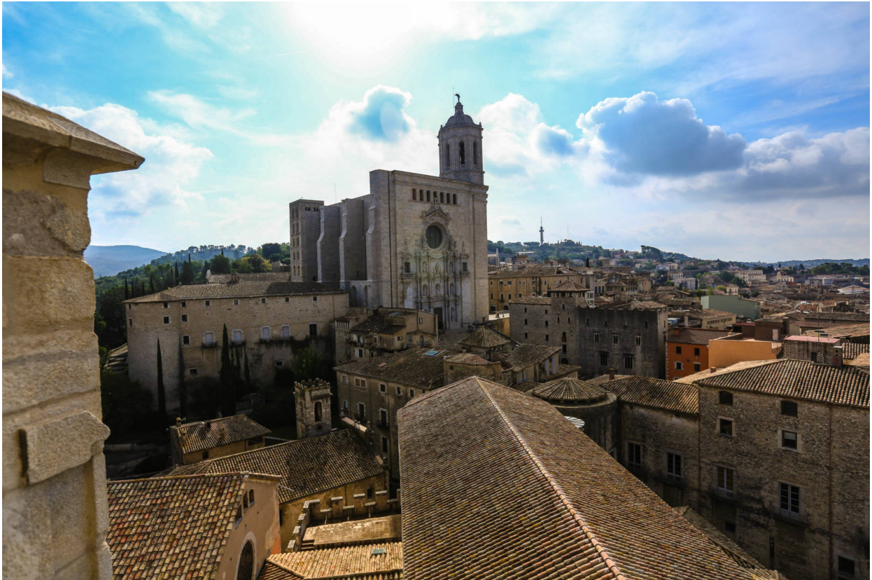
Die Kathedrale von Girona

Die Führungen werden auf Englisch, Spanisch, Französisch und Katalanisch gehalten.