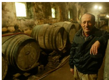
Celler © Mas Molla