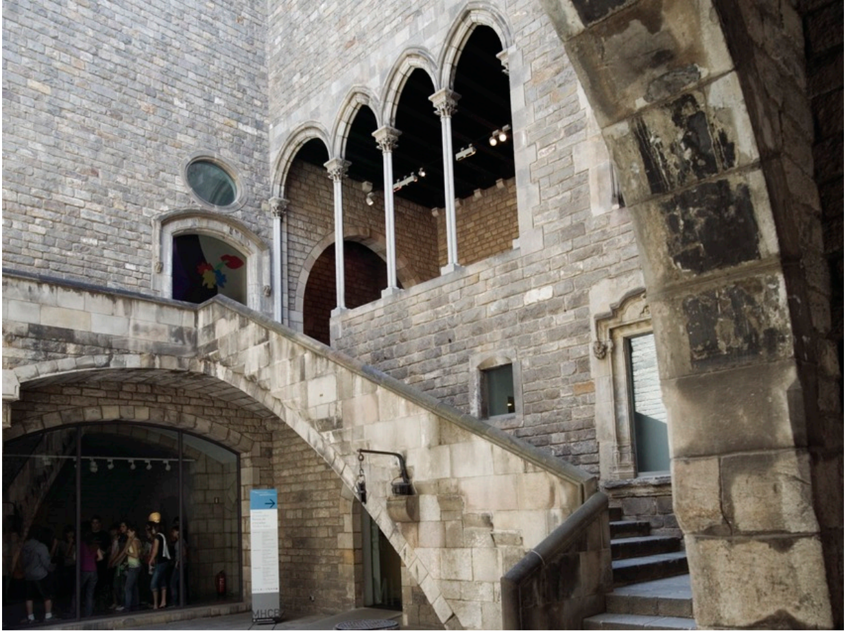
Museu història Barcelona