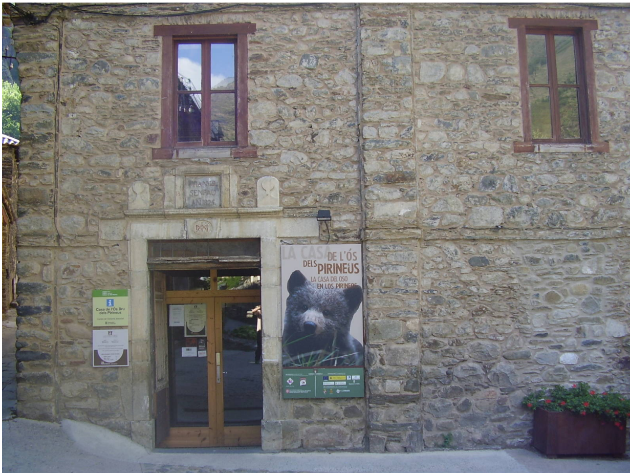
Casa de l'ós

Casa Sastrès d'Isil in Pallars Sobirà ist ein Haus in traditioneller Pyrenäenarchitektur, erbaut aus Stein, Schiefer und Holz. Überdies ist es heute auch ein Interpretationszentrum des Braunbären. Seit einigen Jahren ist der Braunbär in den Pyrenäen wieder heimisch. Im Rahmen des Projektes PIROSLife strebt man ein friedliche Miteinander von Hirtenkultur und Wildleben an. Das Haus des Braunbären gibt spannende Einblicke in das Leben der Braunbären und in die Pyrenäen als ihren Lebensraum. Ausgehend vom Museum gibt es auch eine Reihe von Wanderwegen, die diesem Thema gewidmet sind. Nicht zuletzt kann man hier in Begleitung erfahrener Führer auch den Spuren des Braunbären folgen. Weitere Infos gibt es hier .