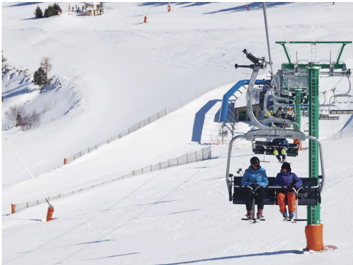
Skistation Espot

Eigentlich hatten Sie schon immer mal vor, das Skifahren zu lernen – aber irgendwie ist es nie dazu gekommen? Dann aufgepasst. Vielleicht erfüllt sich ihr lange gehegter Wunsch am Ende nicht in den Alpen, sondern auf der Iberischen Halbinsel in den Pyrenäen von Lleida. Hier bietet die Skistation Espot Skieinführungskurse für die ganze Familie an. Kinder ab sechs Jahre und ihre Eltern erlernen hier in etwa drei Stunden die wichtigsten Grundlagen des Skifahrens. Skischuhe auswählen, die Ausrüstung zur Piste bringen, in den Sessellift steigen und im Pflug runterfahren sind die ersten Schritte auf dem Weg ins selbständige Skivergnügen. Ein erfahrener Skilehrer zeigt und erklärt die wichtigsten Techniken. Nach einige Runden in Begleitung des Lehrers, trauen sich die Skieinsteiger dann in der Regel schon alleine auf die blauen Pisten.