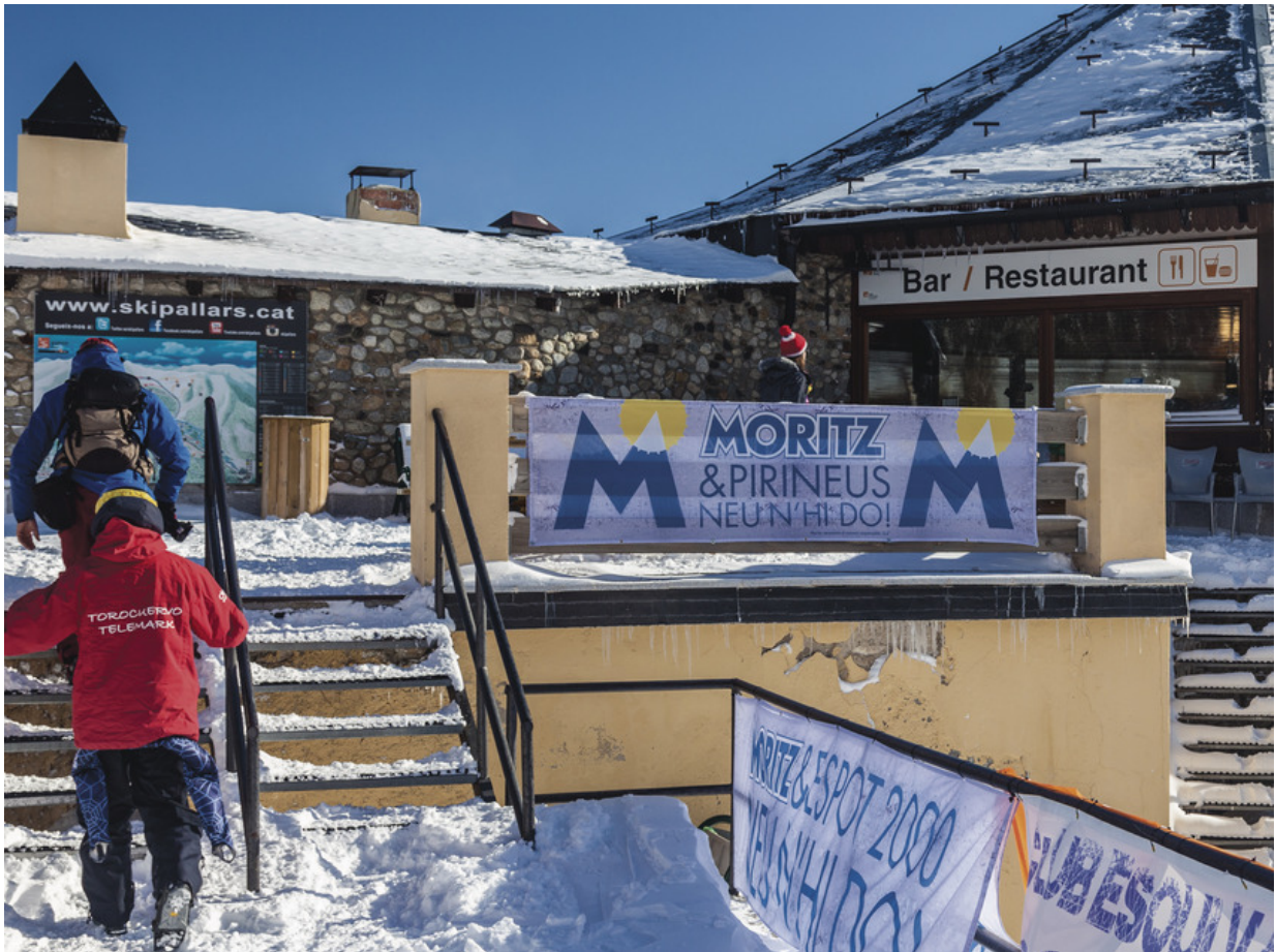
Die Skistation von Espot bietet Wintervergnügen für Familien