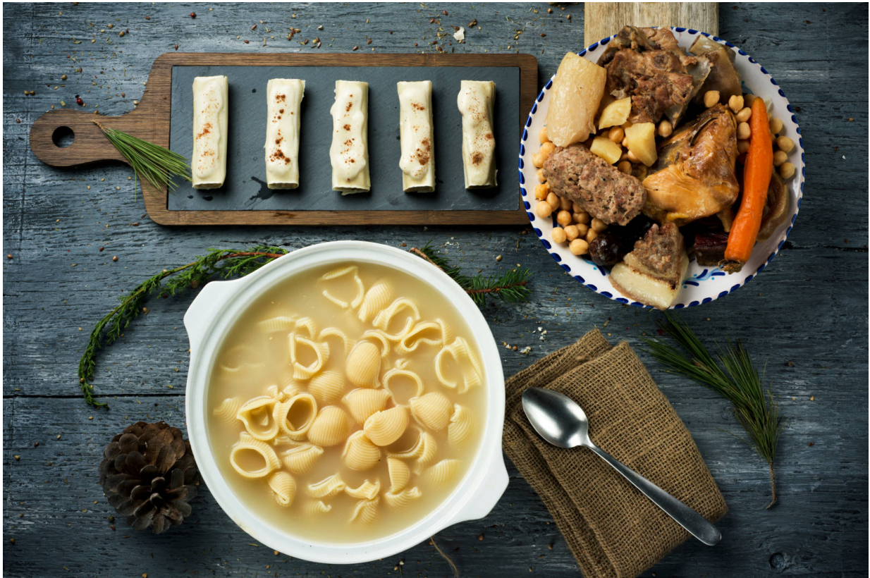
Herzhaft-katalanische Küche.

Viel Bewegung an frischer Luft macht hungrig. In den Valls d'Àneu ist das ein hochwillkommenes Gefühl. Die herzhaft-katalanische Küche schmeckt nämlich mit wirklich hungrigem Magen am Allerbesten. Ein Klassiker ist der katalanische Eintopf aus dem Tontopf – schön warm und mit unverwechselbarem Aroma. Wer's ein bißchen ausgefallener mag, kann hier auch Wildschwein kosten – und schlemmen wie Asterix und Obelix nach einer ihrer legendären Begegnungen mit dem Römern. Infos gibt es hier .