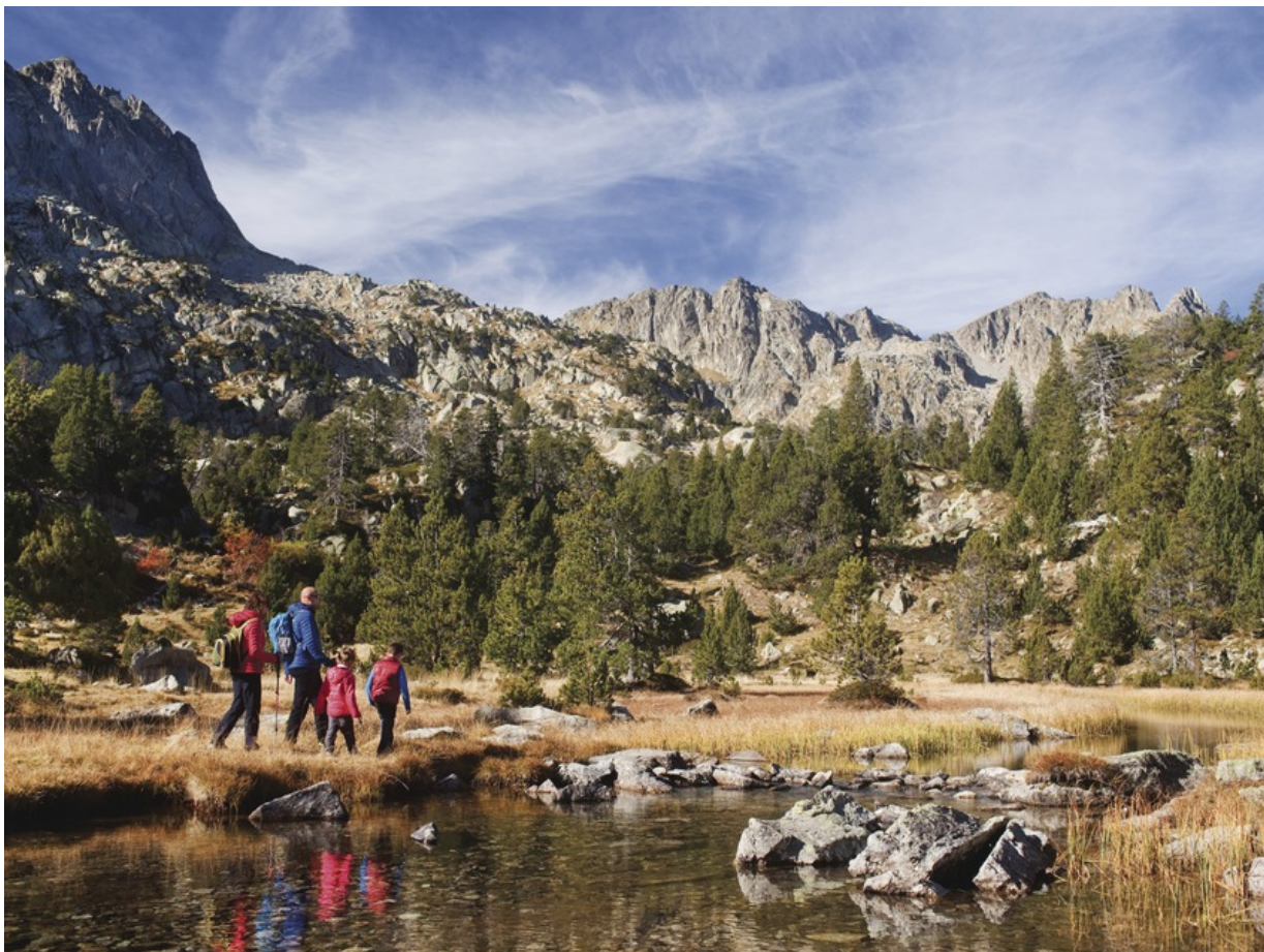
Wanderwege für Familien im Nationalpark Aigüestortes i Estany de Sant Maurici

Und so gibt es hier eine ganze Reihe von Wanderrouten, die kurz, knackig, atemberaubend, garantiert nicht langweilig und absolut kindertauglich sind. Zum Beispiel die Wanderung zum Sant Maurici-See, der auf einer Höhe von 1910m in einem Talbecken liegt. Vom Wanderparkplatz aus braucht man mit Kindern etwa zwei Stunden. Und falls ihre Sprößlinge weite Wanderstrecken nicht gewohnt sind, bietet sich jederzeit die Möglichkeit, auf das Geländewagentaxi auszuweichen. Es fährt zu jeder vollen Stunde und kostet 4,35€ pro Strecke. Und natürlich bietet der Nationalpark auch noch eine ganze Menge weiterer toller Wandermöglichkeiten für Familien. Wer sich über aktuelle Angebote informieren möchte, schaut hier oder hier .