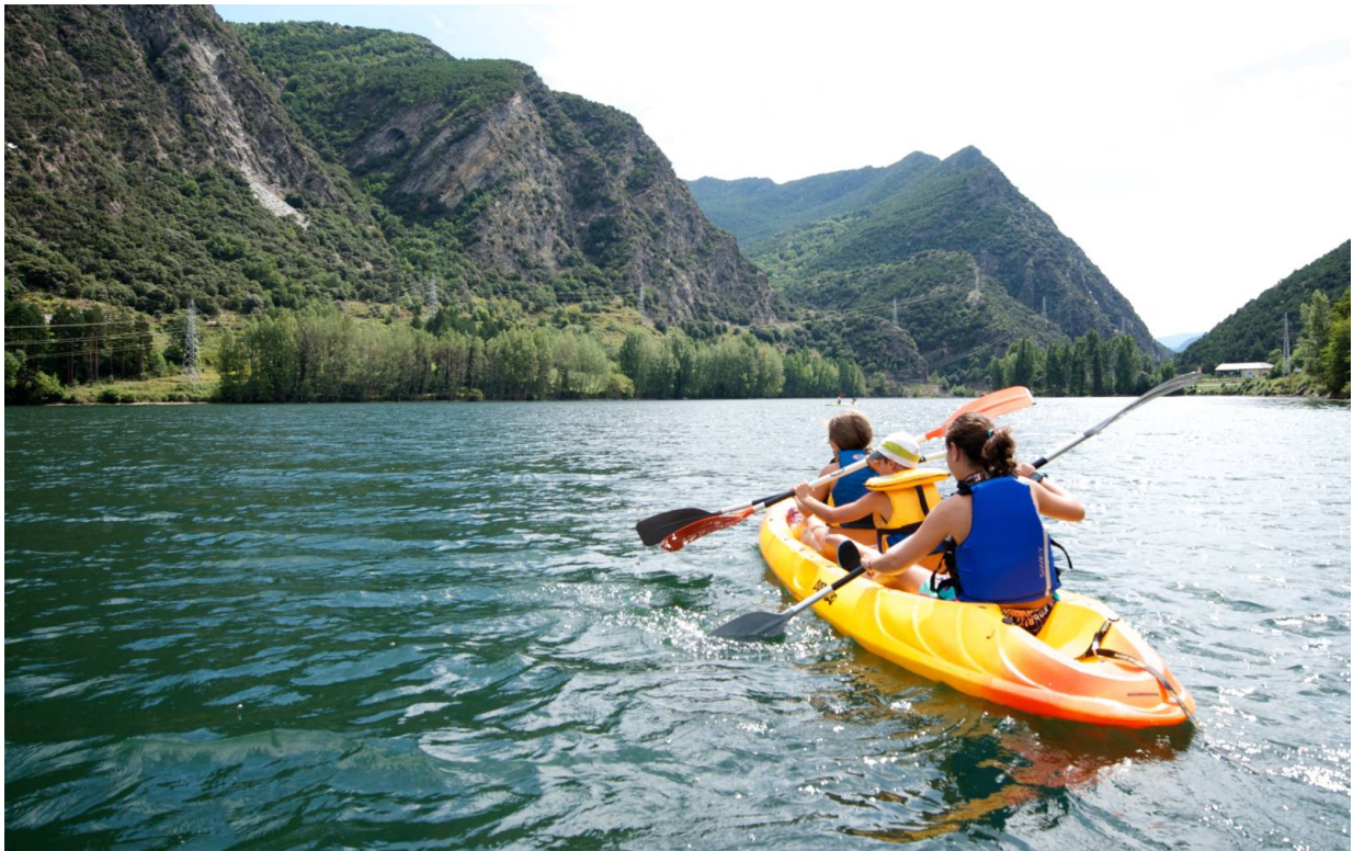
Wassersporta am See La Torrassa

Wer glaubt, die Valls d'Àneu seien im Winter besonders spannend und unterhaltsam, der hat natürlich recht. Das Gleiche lässt sich allerdings auch über die Sommermonate sagen. Denn wenn die Skisaison zu Ende geht, beginnt auch schon fast die Wassersportsaison. Der Torrassa-See ist ein echtes El Dorado für Wassersportler, sei es im Kanu, Kayak oder beim SUP. Wer es noch ein bisschen abenteuerliche mag, darf natürlich auch die Wildwasser-Aktivitäten ausprobieren. Infos gibt es hier .